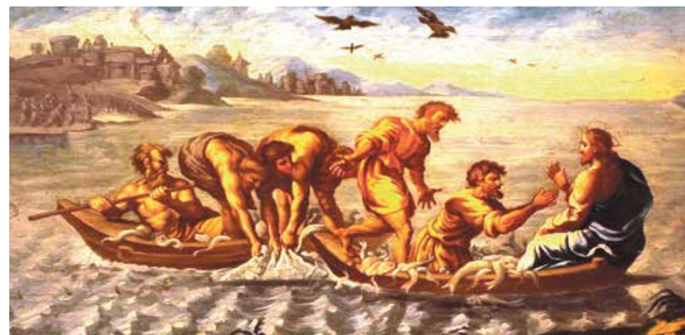
Bayeu: Boceto del Lago de Tiberíades. Catedral de Jaca.