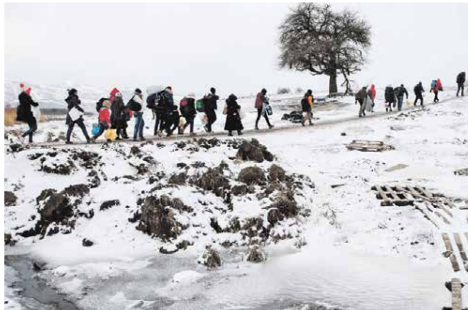
Numerosos católicos se están solidarizando con los refugiados.

Ahora mismo, cientos de niños, jóvenes, adultos y ancianos que huyen de la guerra, de la miseria y de la persecución se agolpan a las puertas de Europa malviviendo e, incluso, malmuriendo. Ante esta situación, endurecida por el frío propio del invierno, la Iglesia reivindica el valor sagrado e inviolable de toda vida humana. Y, para ello, recuerda que las personas necesitamos vivir en unas mínimas condiciones materiales y espirituales.