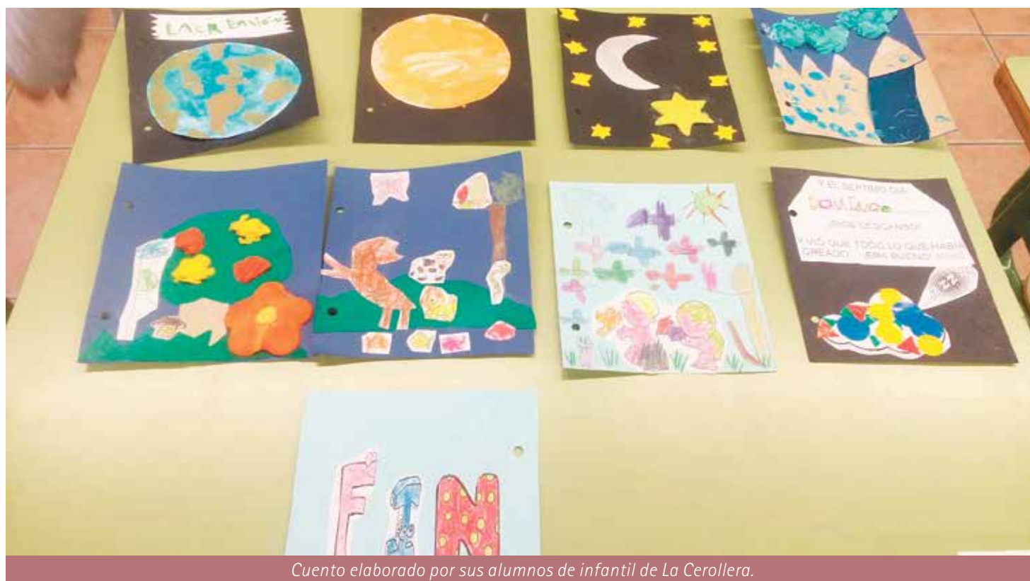
Cuento elaborado por sus alumnos de infantil de La Cerollera.

Las clases eran internivelares. Podía encontrar en la misma clase a niños desde los 3 hasta los 12 años de