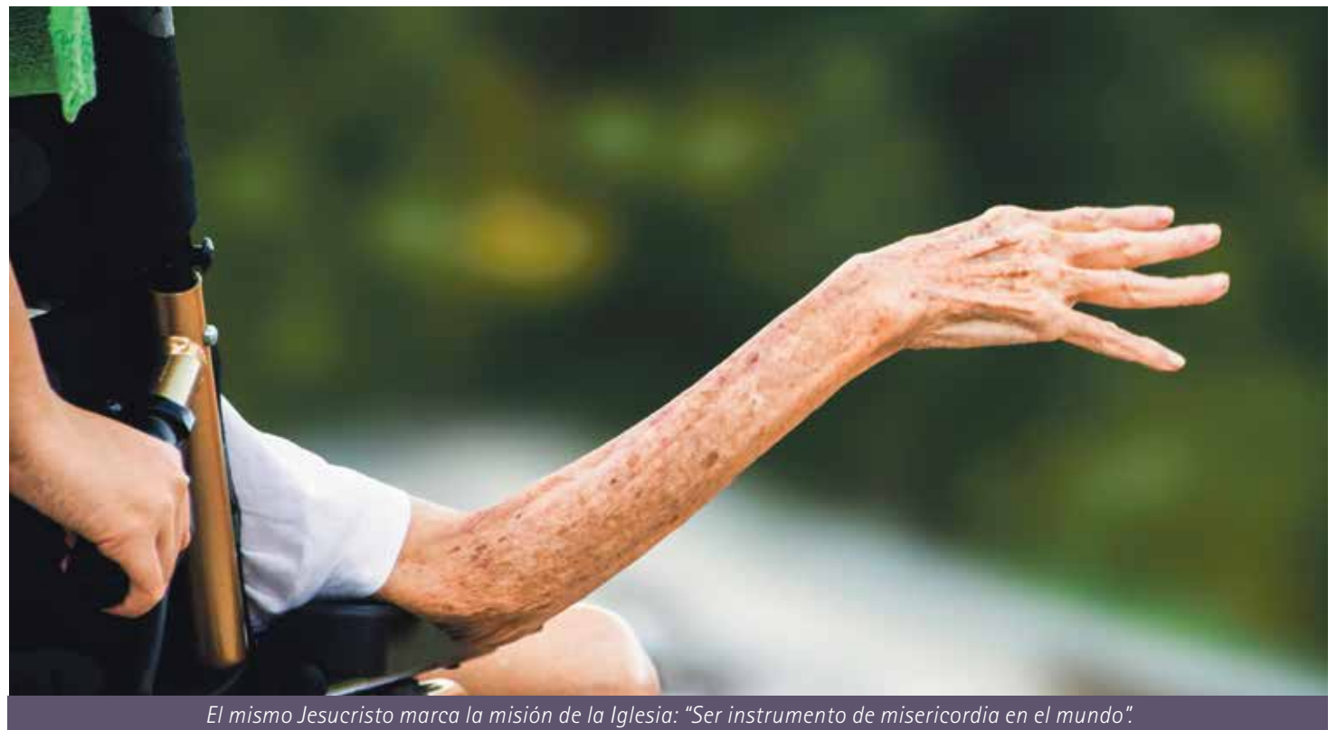
El mismo Jesucristo marca la misión de la Iglesia: "Ser instrumento de misericordia en el mundo".

En la carta apostólica "Misericordia et misera" el papa emplea la expresión "nueva evangelización" unida a "conversión pastoral", conversión que pasa por la fuerza renovadora y evangelizadora de la misericordia en nuestra pastoral eclesial, que se traduce en una pastoral del diálogo y de la Palabra de Dios, además de la pastoral de la consolación.