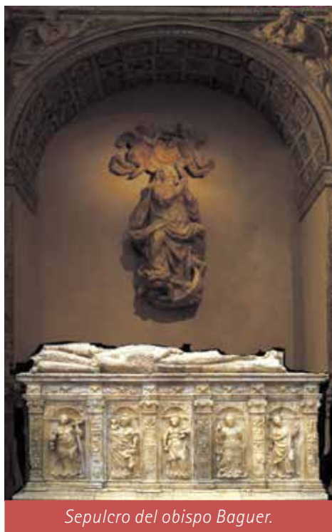
Sepulcro del obispo Baguer.

Empezamos el mes de febrero hablando de uno de los personajes más interesantes de la historia moderna jaquesa: el obispo don Pedro de Baguer cuyo sepulcro renacentista de alabastro se sitúa en el interior de la Catedral.