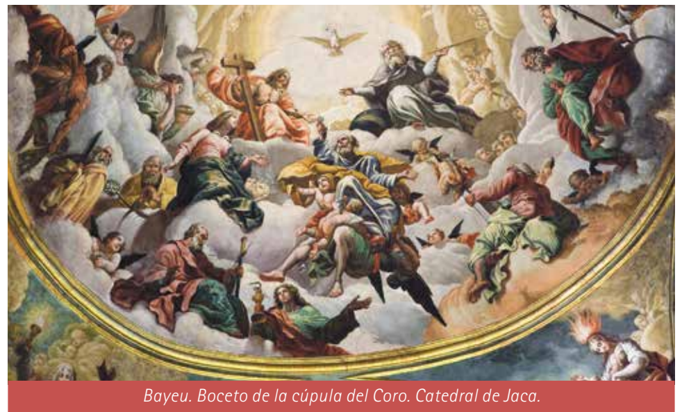
Bayeu. Boceto de la cúpula del Coro. Catedral de Jaca.