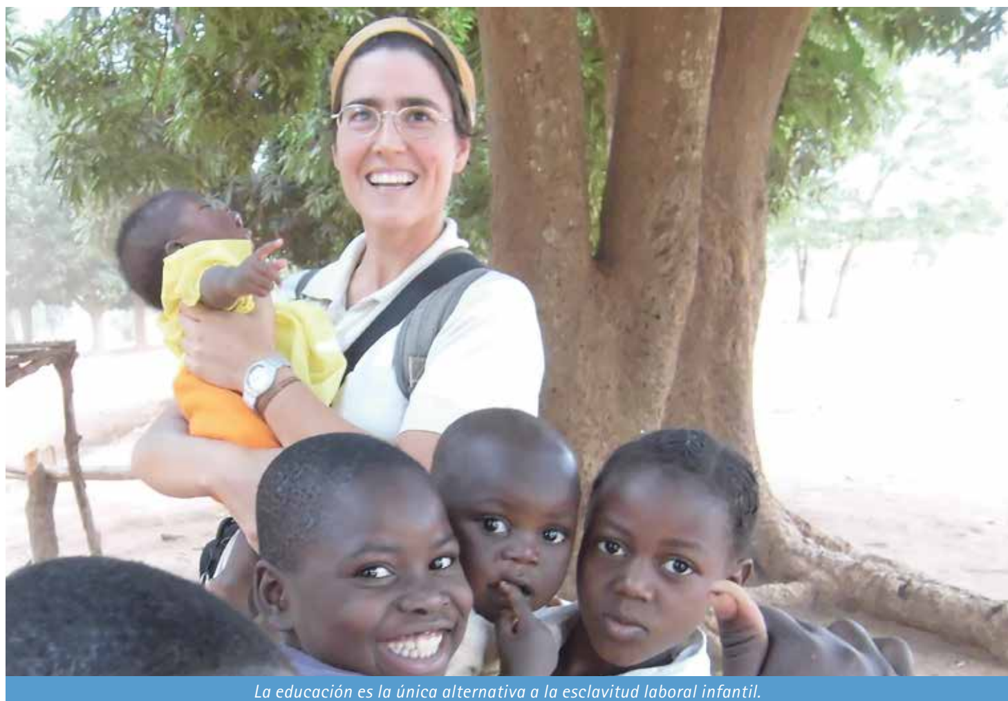
La educación es la única alternativa a la esclavitud laboral infantil.

Manos Unidas denuncia que un tercio de nuestros alimentos acaba en la basura; mientras que 800 millones de personas siguen pasando hambre en el mundo. Ante estas cifras, hace hincapié en tres cuestiones esenciales y urgentes para acabar con el hambre en el mundo: el desperdicio de alimentos, la lucha contra la especulación alimentaria y el compromiso con una agricultura respetuosa con el medio ambiente que asegure el consumo local.