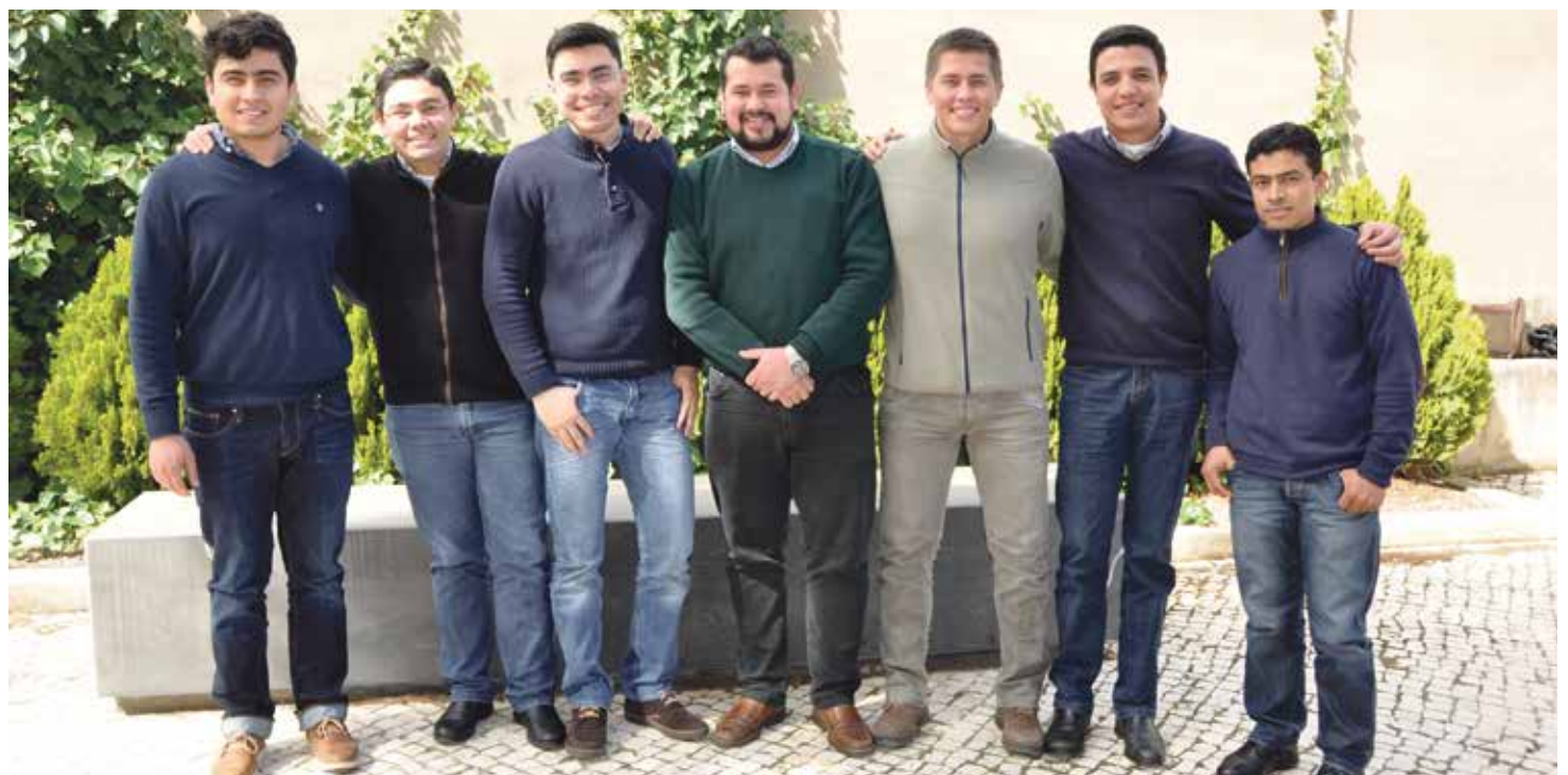
Los seminaristas de las diócesis aragonesas cursan los estudios teológicos en el CRETA (en la foto, seminaristas de Huesca y de Jaca).

Para realizar una acción es necesario saber en qué consiste y tener los mejores y más adecuados instrumentos. Para formar sacerdotes, pastores del pueblo de Dios, es necesario contar con un seminario. Y un seminario no es un edificio... más bien es una comunidad educativa 'sostenible': número suficiente de seminaristas, equipo solvente de formadores, los mejores y más cualificados profesores, un clima humano y sobrenatural que garantice el desarrollo humano y discipular del llamado.