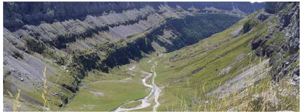
Parque Nacional de Ordesa.