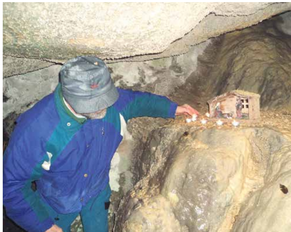
Belén montañero en la cueva de Santa Elena.

El belén encierra múltiples valores: es la manifestación del amor divino a los hombres, nos muestra la sencillez como estilo de vida y su montaje es un momento para celebrar e la alegría de la Navidad. El Belén Montañero cumple estos tres valores. Con frecuencia se organiza en lugares accesibles para que puedan asistir incluso familias con niños pequeños o gente de mayor edad. Normalmente se instala el belén debajo de una pequeña oquedad o entrante de la roca, para que quede resguardado, simulando