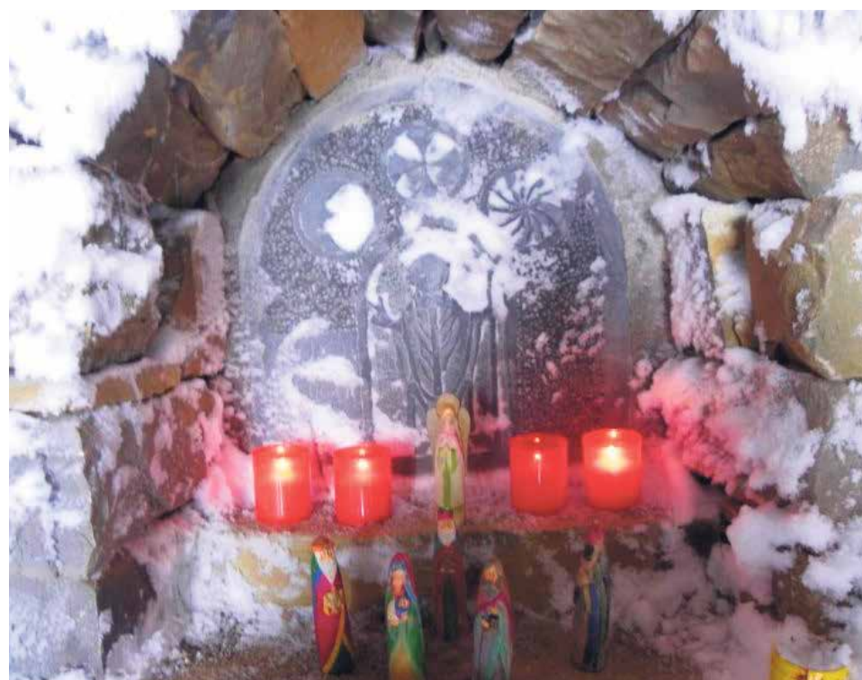
Ermita de San Benito de Erata.

la cueva donde tuvo lugar el nacimiento de Jesús.