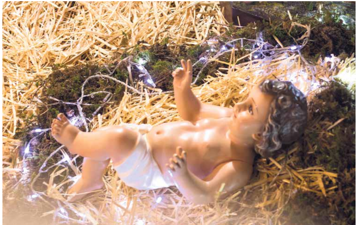
"Invitaré a mis hijos a que miren el niño del Belén con ojos agradecidos".

Tal vez, entonces, nosotros mismos, los cristianos, hemos sido los primeros que,