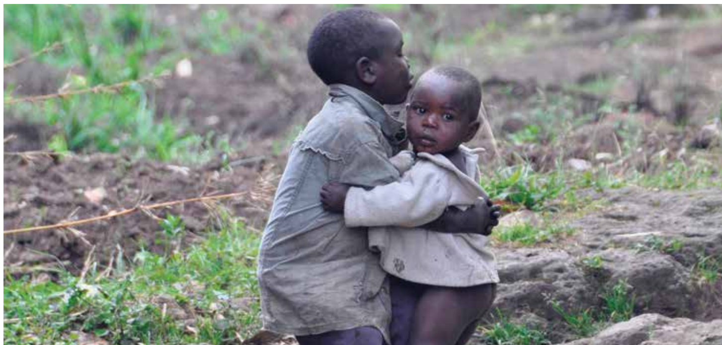
Dios invita a amar infinitamente a cada persona, con auténtico espíritu cristiano.

Frente a grandes teorías o abundantes explicaciones, el Santo Padre identifica las bienaventuranzas como el "carnet de identidad del cristiano". En el tercer capítulo de 'Gaudete et exsultate', titulado 'A la luz del maestro', apunta la necesidad de apoyarse en el Espíritu Santo para vivir el mensaje de Jesús, porque aunque es atractivo, "en realidad el mundo nos lleva hacia otro estilo de vida".