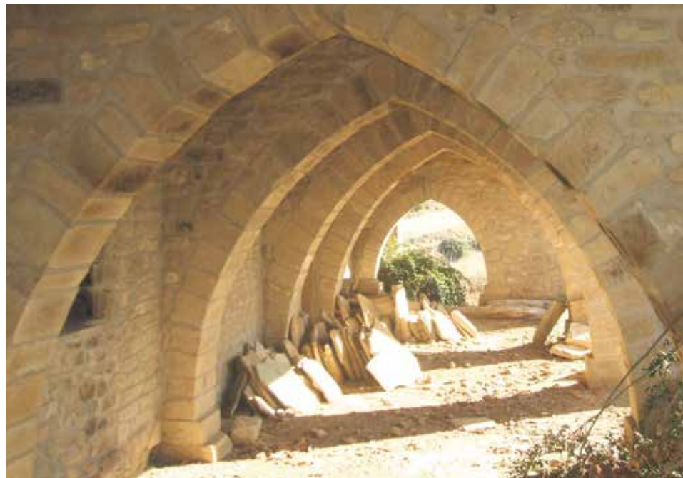
Iglesia de Santa María, en Barués (Sos del Rey Católico).

La semana pasada lo hicimos con las ermitas, hoy, ofrecemos a continuación la lista de templos parroquiales, además de los anejos y otros, enclavados en la diócesis, cuyo titular es una advocación mariana. Salen más de sesenta.