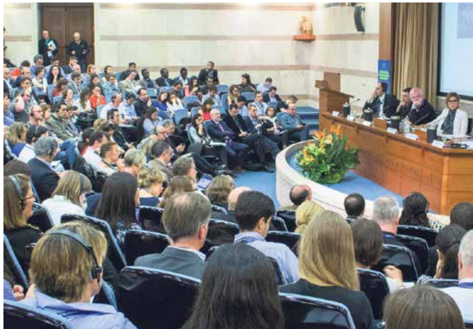
La delegación de Medios de la archidiócesis de Zaragoza asistió en abril a un congreso en Roma dirigido a oficinas de comunicación de la Iglesia.

Y surge la pregunta: ¿Cómo podemos reconocerlas? Ante esta cuestión, "ninguno de nosotros puede eximirse