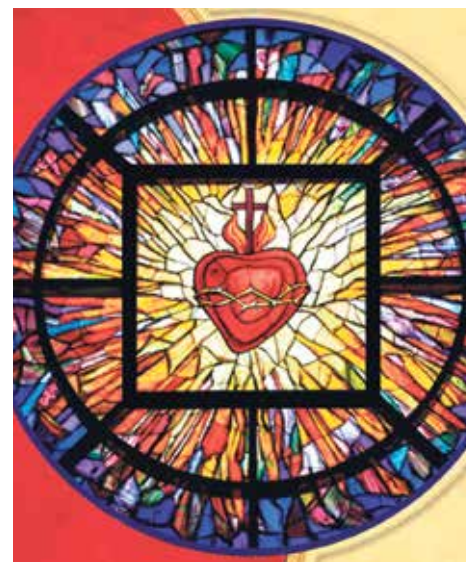
Vidriera del Apostolado de la Oración.

Mártir - Jesuitas, la "Compañía de Jesús".