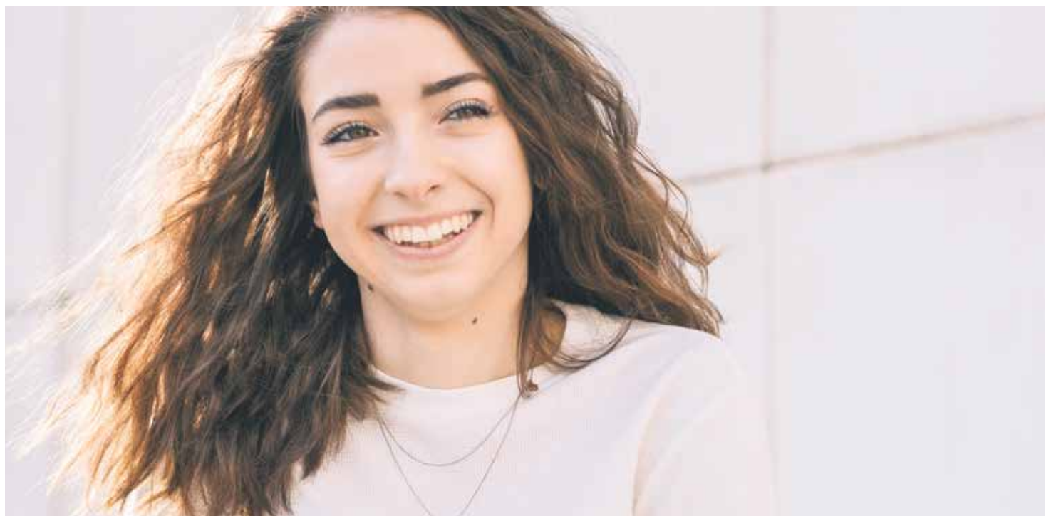
El santo es capaz de vivir con alegría y sentido del humor.

A los medios de santificación ya conocidos, como la oración, los sacramentos de la Eucaristía y la Reconciliación, la ofrenda de sacrificios, las diversas formas de devoción y la dirección espiritual, entre otros, el papa Francisco suma cinco grandes manifestaciones del amor a Dios y al prójimo que considera de particular importancia en la cultura de hoy. Los presentamos.