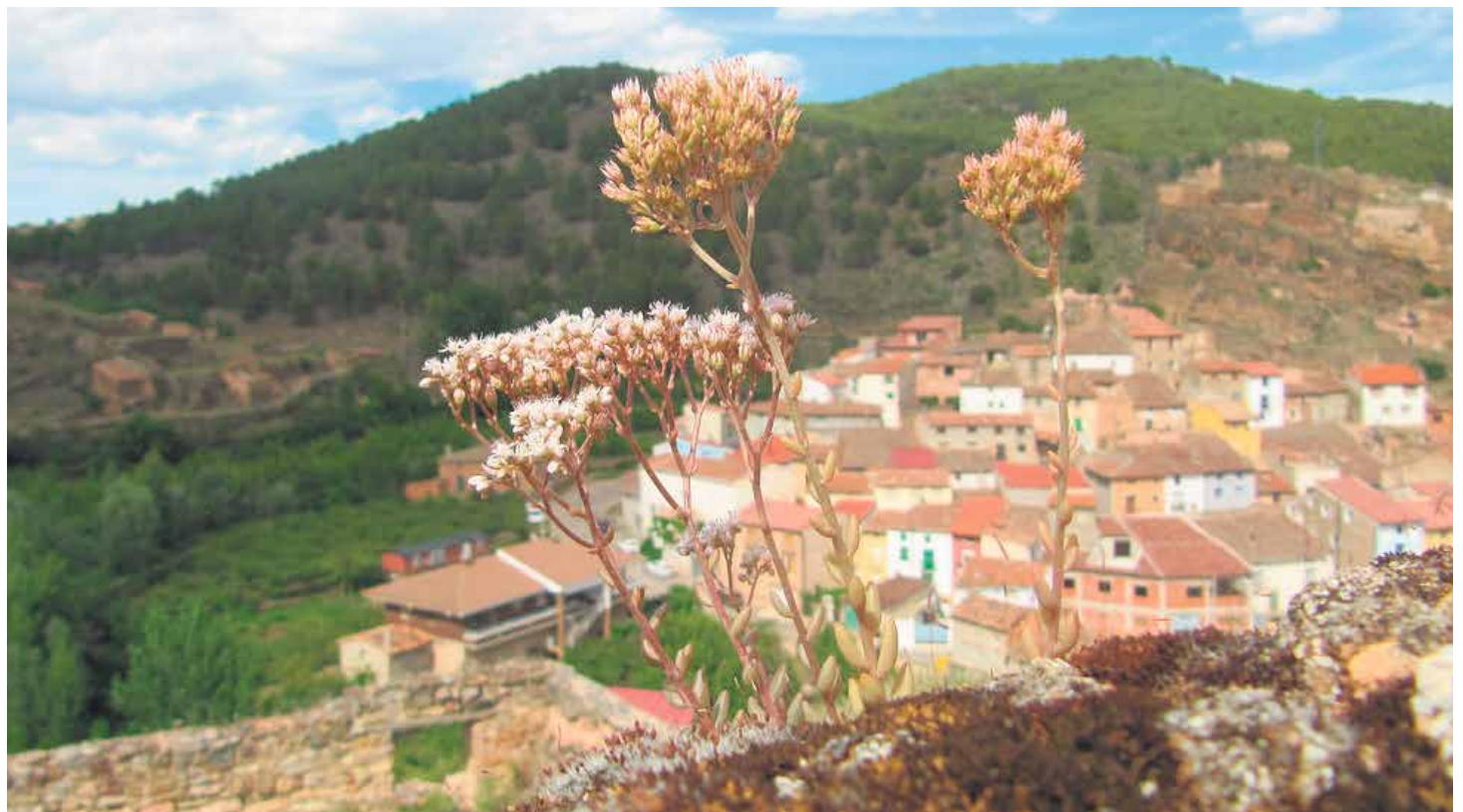
Es necesario que en todos los núcleos de población, por pequeños que sean, no solo se viva bien, sino decentemente.

Hay dos tipos de pueblos: los que se parecen a las ciudades y los que tienen fecha de cierre. Estos últimos superan el cincuenta por ciento de los municipios aragoneses. ¿Cómo debe mirar esta realidad un cristiano en nuestras coordenadas? Desde luego, es un asunto político, pero no hay que confundir: lo político supera y trasciende las tácticas de los partidos; político quiere decir que afecta al bien común de la sociedad. Pues si afecta a todos, también afecta a la Iglesia.