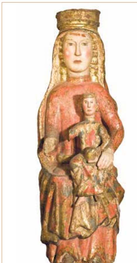
Virgen con Niño.

Románico. Siglo XIII. Talla en madera policromada. Procedencia desconocida.