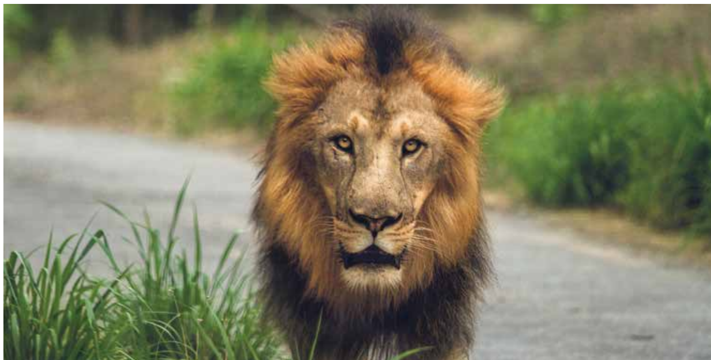
Nuestro camino hacia la santidad es también una lucha constante.

En el quinto y último capítulo de 'Gaudete et exsultate', el papa Francisco advierte que la vida cristiana es un combate permanente. Una lucha "muy bella" porque permite celebrar la victoria del Señor en nuestra vida, pero que requiere "fuerza y valentía para resistir las tentaciones del diablo y anunciar el Evangelio". Veamos las últimas reflexiones del Santo Padre sobre cómo vivir una santidad auténtica en nuestro mundo.