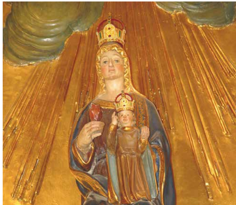
Nuestra Señora de Monlora.

Santa María: “Ella vivió como nadie las bienaventuranzas de Jesús. Ella es la que se estremecía de gozo en la presencia de Dios, la que conservaba todo en su corazón y se dejó atravesar por la espada. Es la santa entre los santos, la más bendita, la que nos enseña el camino de la santidad y nos acompaña. Ella no acepta que nos quedemos caídos y a veces nos lleva en sus brazos sin juzgarnos. Conversar con ella nos consuela, nos libera y nos santifica. La Madre no necesita de muchas palabras, no le hace falta que nos esforcemos demasiado para explicarle lo que nos pasa. Basta musitar una y otra vez: «Dios te salve, María...» (Papa Francisco, Exh. Apost. Gaudete et exsultate , 176).