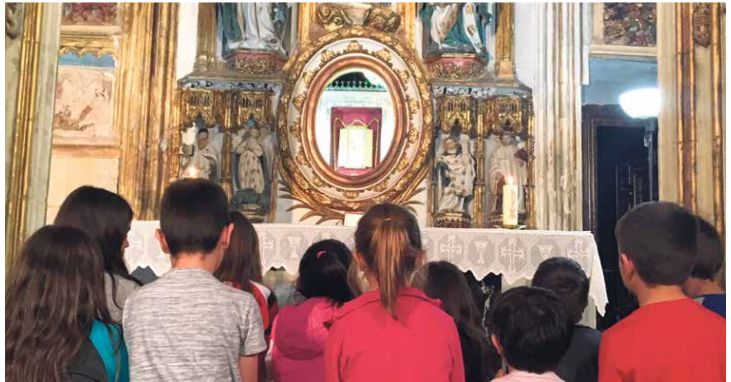
Los niños de Primera Comunión de la parroquia de Daroca rezan ante los Sagrados Corporales.

San Manuel González, gran apóstol de la eucaristía, no entendía un cristianismo sin eucaristía y sin sagrarios acompañados. Él pensaba que la semilla de la fe nacía y maduraba a la luz de la lámpara del sagrario y que nuestro ser apóstoles era un ir y venir del sagrario al prójimo. Estas intuiciones, recogidas en sus obras y en su espiritualidad, están también contempladas en el magisterio de la Iglesia.