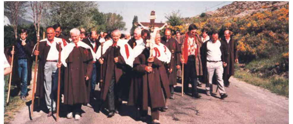
Romeros del Cuerpo de Santa Orosia.

Con motivo de la celebración del Quinientos aniversario de la Regla de Romeros en este año 2018, y coincidiendo con la reciente fundación de la Cofradía de Santa Orosia en Yebra de Basa, es deseo de la Real Cofradía de Santa Orosia de Jaca celebrar dicha efeméride. Para ello se ha preparado con cariño un programa de actos conmemorativos: