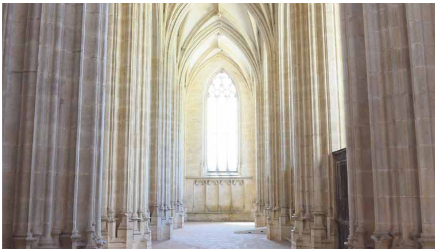
Los consagrados, al apartarse del mundo, descubren con mejor perspectiva la presencia de Dios en el corazón de la creación.

El domingo 27 de mayo, solemnidad de la Santísima Trinidad, se celebra la Jornada Pro Orantibus. Los obispos españoles, en el Año Jubilar Teresiano, proponen como lema la invitación de Santa Teresa, 'Solo quiero que le miréis a Él'. Además manifiestan "el agradecimiento y, a la vez, el apoyo paternal a los innumerables hombres y mujeres que esparcidos por la geografía española mantienen vivo el ideal religioso de la vida contemplativa".