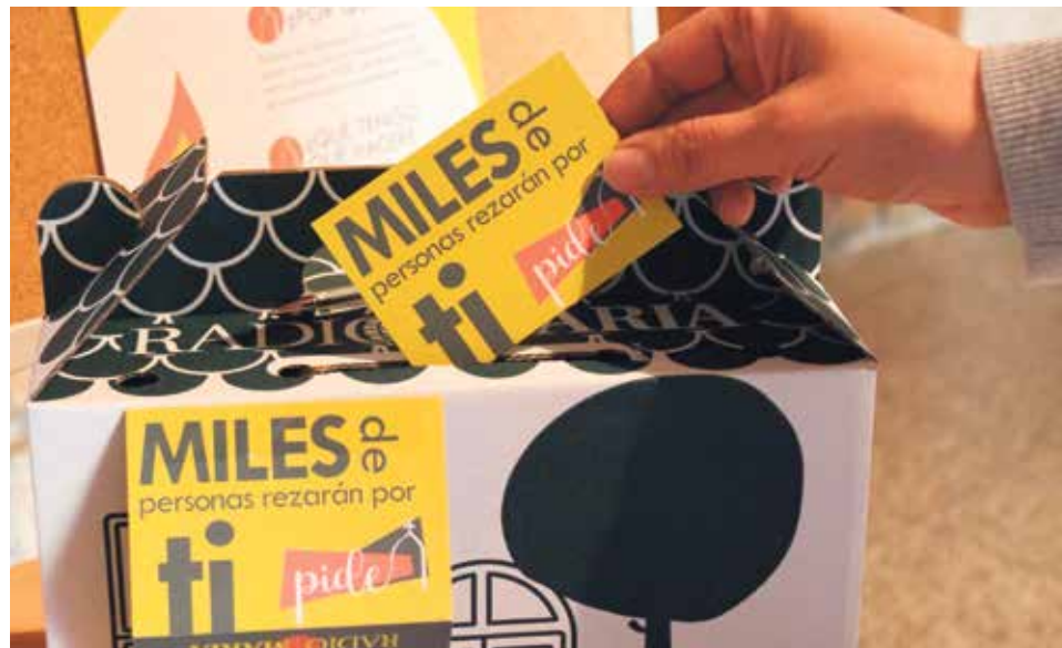
Quien lo desee puede depositar en estas casas-buzón sus peticiones a Dios.

La profundización en la vida de oración se hace especialmente a través de los diferentes programas de la radio