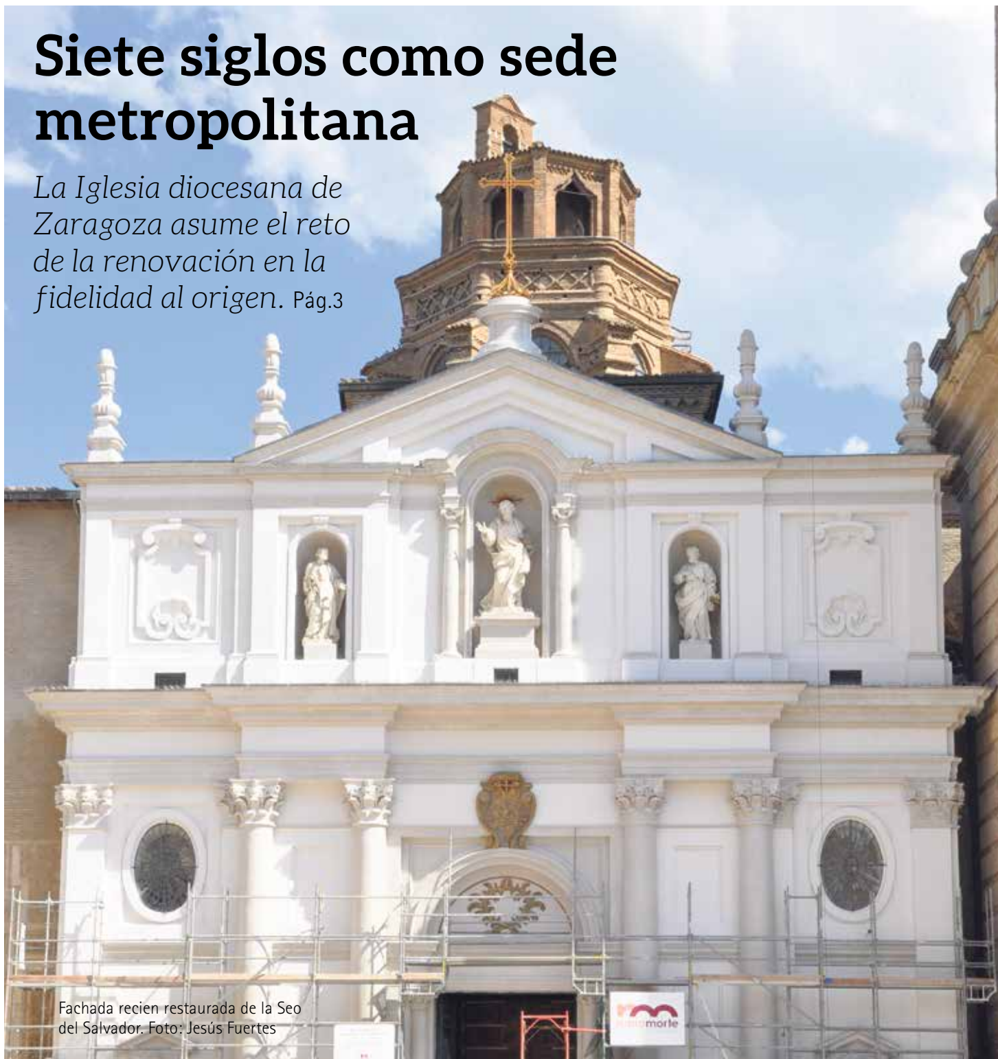
Fachada recién restaurada de la Seo del Salvador.

La Iglesia diocesana de Zaragoza asume el reto de la renovación en la fidelidad al origen. Pág.3