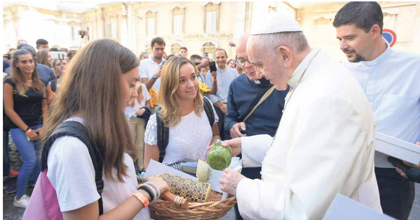
Los jóvenes piden ser acompañados, a nivel espiritual, formativo, familiar, vocacional.

4.- Discernimiento: es una de las palabras mayormente presentes