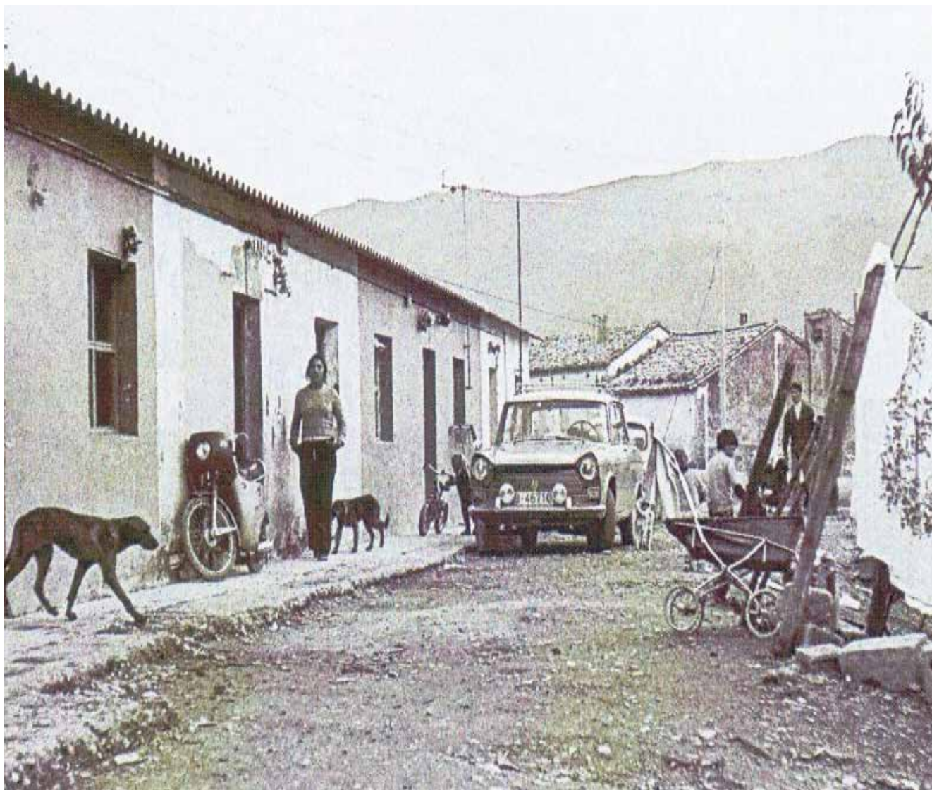
Barrio San Jorge de Jaca. Años 70.

Suministros: Gas, gasoil, luz y otros: 4.343,93 €