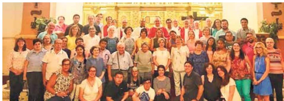
Grupo de asistentes al curso de Peralta de la Sal.

Bajo el lema: ‘¡Engánchate a Jesús! La alegría de ser catequista’, se dieron cita alrededor de setenta catequistas y agentes de pastoral de las diferentes Diócesis.