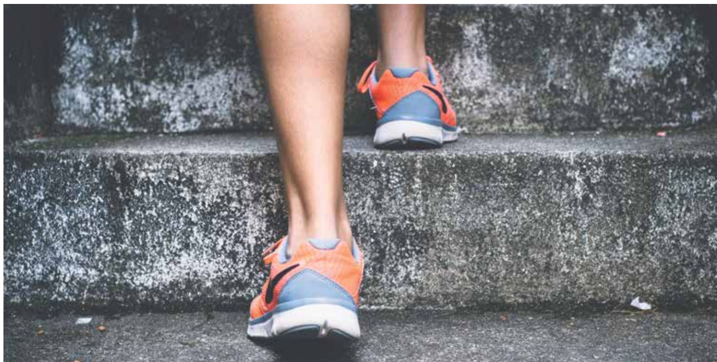
La práctica deportiva ayuda alcanzar la unidad de cuerpo, alma y espíritu.

La Iglesia y el deporte mantienen una enriquecedora relación. Prueba de ello es el documento 'Dar lo mejor de uno mismo', publicado por la Santa Sede el pasado 1 de junio. Tanto en la práctica deportiva como en la vida, asegura el papa Francisco, se trata de "hacerlo lo mejor posible". Una nueva llamada a la santidad que 'Iglesia en Aragón' recoge para sus lectores con algunos de los pasajes más destacados.