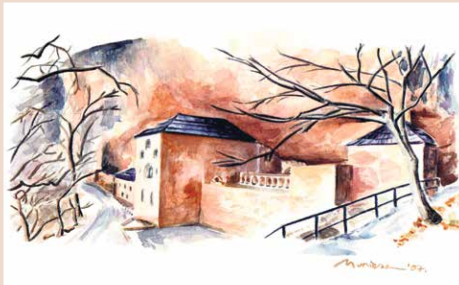
Acuarela de San Juan de la Peña, obra de la autora, Pilar Muniesa.

Retomamos el camino hacia Huesca, dejando atrás lugares que no podemos olvidar. Es el caso de Barbastro y la villa de Alquézar, en