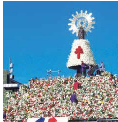
Ofrenda de Flores a la Virgen del Pilar

Este año 2018 se han inscrito un total de 775 grupos para la Ofrenda de Flores a la Virgen del Pilar, 71 más que el año pasado.