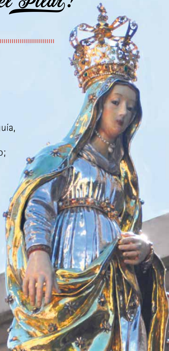
Imagen procesional en plata de la Virgen del Pilar, obra de Miguel Cubells (s. XVII).