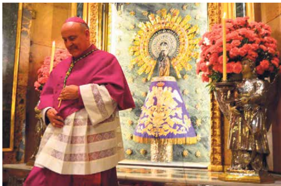
La Virgen del Pilar, punto de partida hacia Dios.

Esta herencia de fe mariana de tantas generaciones —decía el papa san Juan Pablo II en su estancia en Zaragoza, el 6 de noviembre de 1982— ha de convertirse no sólo en recuerdo, sino en punto de partida hacia Dios. Las oraciones y sacrificios ofrecidos, el latir vital de un pueblo, que expresa ante María sus seculares gozos, tristezas y esperanzas, son piedras nuevas que elevan la dimensión sagrada de una fe mariana".