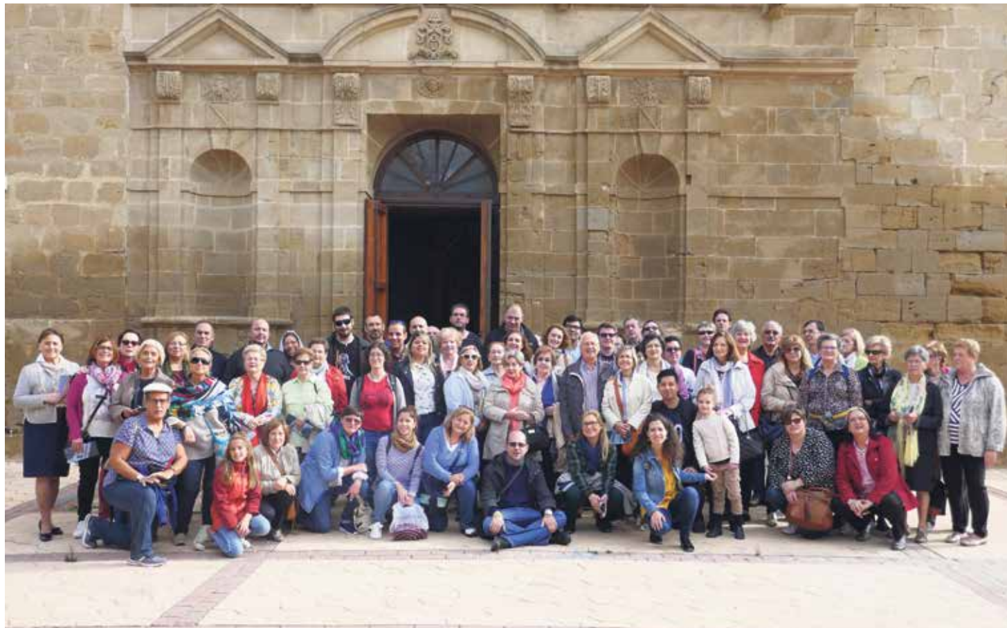
Encuentro Regional de Catequistas del año pasado.

Igualmente la Exhortación nos delinea unos peligros que corremos a la hora de vivir el camino espiritual y de los cuales nadie está libre. El Papa también nos marca una serie de características de la santidad del