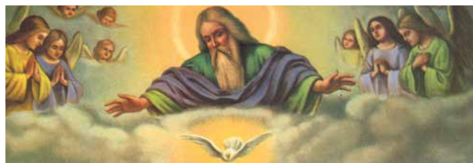
Dios Padre Nuestro.

Estamos tan acostumbrados a rezar el Padrenuestro de corrido que muchas veces no sentimos en nuestro corazón lo que nuestros labios expresan. He aquí una sencilla pero profunda reflexión: