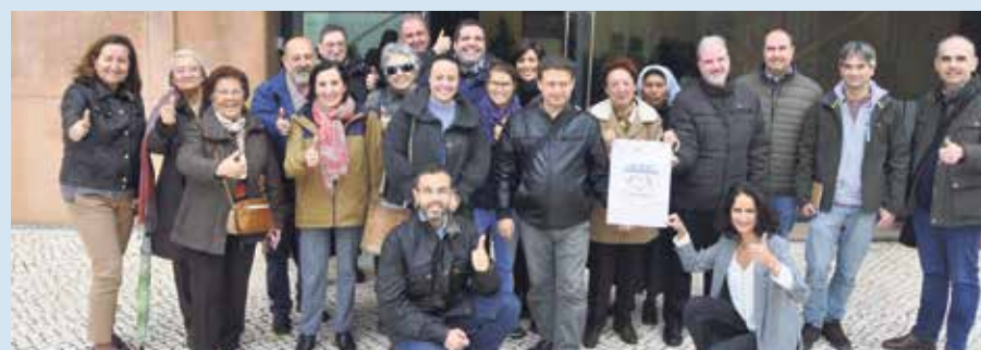
Los asistentes participaron activamente en la jornada.

Después de un descanso, llegó el turno de trabajo. La puesta en marcha