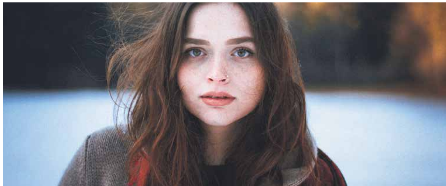
El joven vive la gran aventura de convertirse en adulto, y en ese proceso se juega la mayor toma de decisiones de su vida.

El joven vive la gran y difícil aventura de convertirse en adulto, de madurar, y en ese proceso se juega la mayor toma de decisiones de su vida. Unas decisiones que marcarán definitivamente su vida; unas decisiones en las que se juega su felicidad. En esta aventura de madurar y de responder a sus anhelos más profundos, Jesús se hace el encontradizo. En ese caminar de los jóvenes, en ese proceso de crecer, la Iglesia ha de descubrir la forma de hacerse la encontradiza por medio de verdaderos acompañantes que con respeto y libertad, con formación y entrega, con paciencia y tesón, con oración y acción sean capaces de interpelar al joven para descubrir el proyecto de Dios en su vida viviendo en clave de discernimiento.