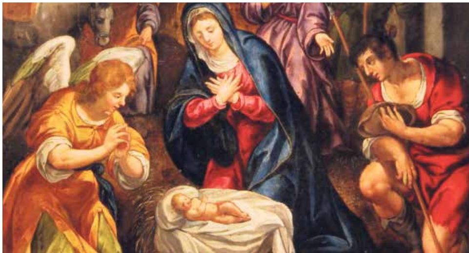
Adoración de los pastores.

Renacimiento, finales del siglo XVI. Óleo sobre plancha de cobre. Procede de la catedral de San Pedro de Jaca