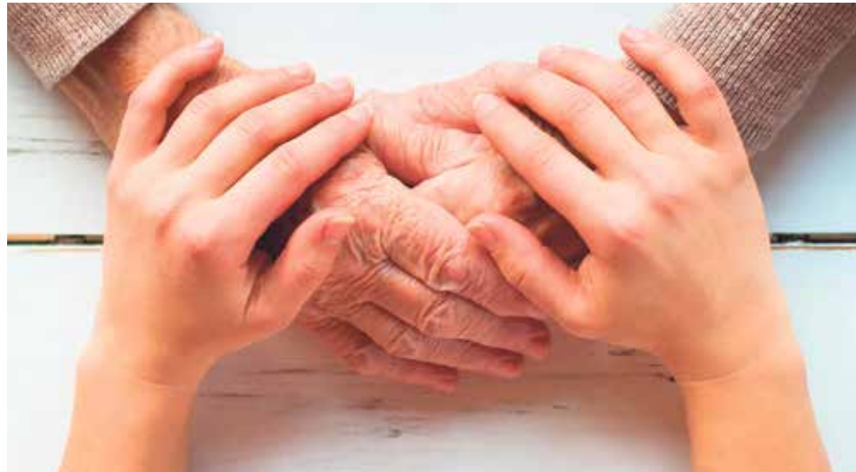
El programa aporta claves sobre las tareas de la comunidad cristiana en el mundo de la salud.