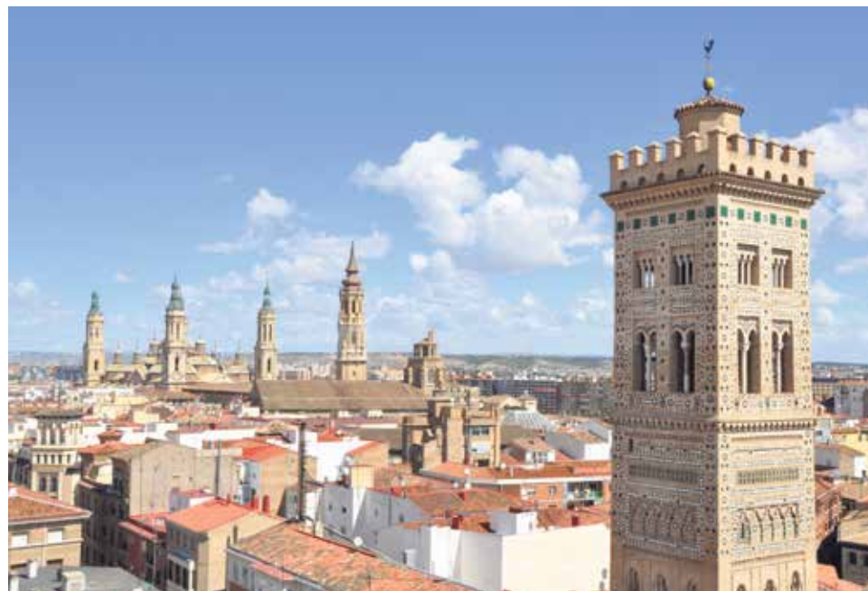
La iglesia parroquial de la Magdalena reabrirá oficialmente sus puertas el 17 de febrero.

Otra de las joyas del programa es la iglesia parroquial de San Pablo Apóstol, con una visita guiada a las 11.00 horas. Conocida popularmente como la tercera catedral de Zaragoza, tuvo su origen en una ermita dedicada a San Blas, sobre el año 1118. Posteriormente, se fue convirtiendo en el amplio edificio que ha llegado