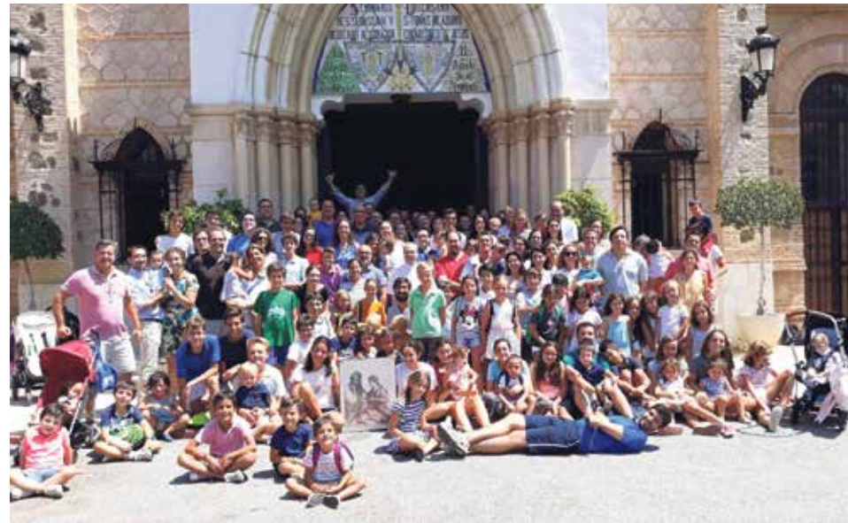
Familias del máster en el encuentro del pasado verano en Málaga.

Entonces le explico a mi compañero sorprendido: "Este master es una especialidad universitaria en Pastoral Familiar ideado por el Pontificio Instituto Teológico Juan Pablo II para Ciencias del Matrimonio y de la