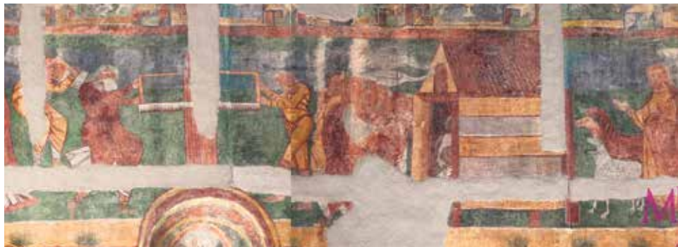
El Diluvio Universal y el Arca de Noé.

Románico, hacia 1100. Pintura al fresco arrancada y traspasada a lienzo. Procede de la iglesia de Santos Julián y Basilisa de Bagüés