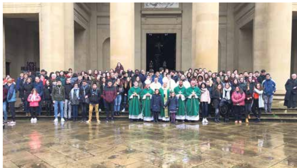
Encuentro de jóvenes en Pamplona

El fin de semana 26 y 27 de enero un grupo de siete jóvenes de la diócesis de Jaca fuimos a Pamplona para celebrar en sintonía con el Papa y los jóvenes del mundo entero la JMJ 2019. La idea surgió de la Delegación de la Juventud de Pamplona ante la imposibilidad de que muchos jóvenes, ya sea por motivos de estudio, laboral o económico puedan acudir a Panamá, vivan y sientan el ambiente del encuentro de una forma distinta. Nos congregamos jóvenes de Pamplona, San Sebastián y Jaca.