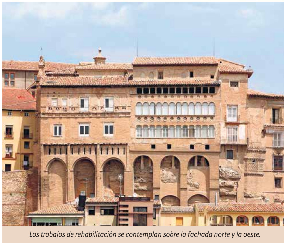
Los trabajos de rehabilitación se contemplan sobre la fachada norte y la oeste.

“ El Palacio Episcopal de Tarazona está abierto todos los fines de semana, mañana y tarde