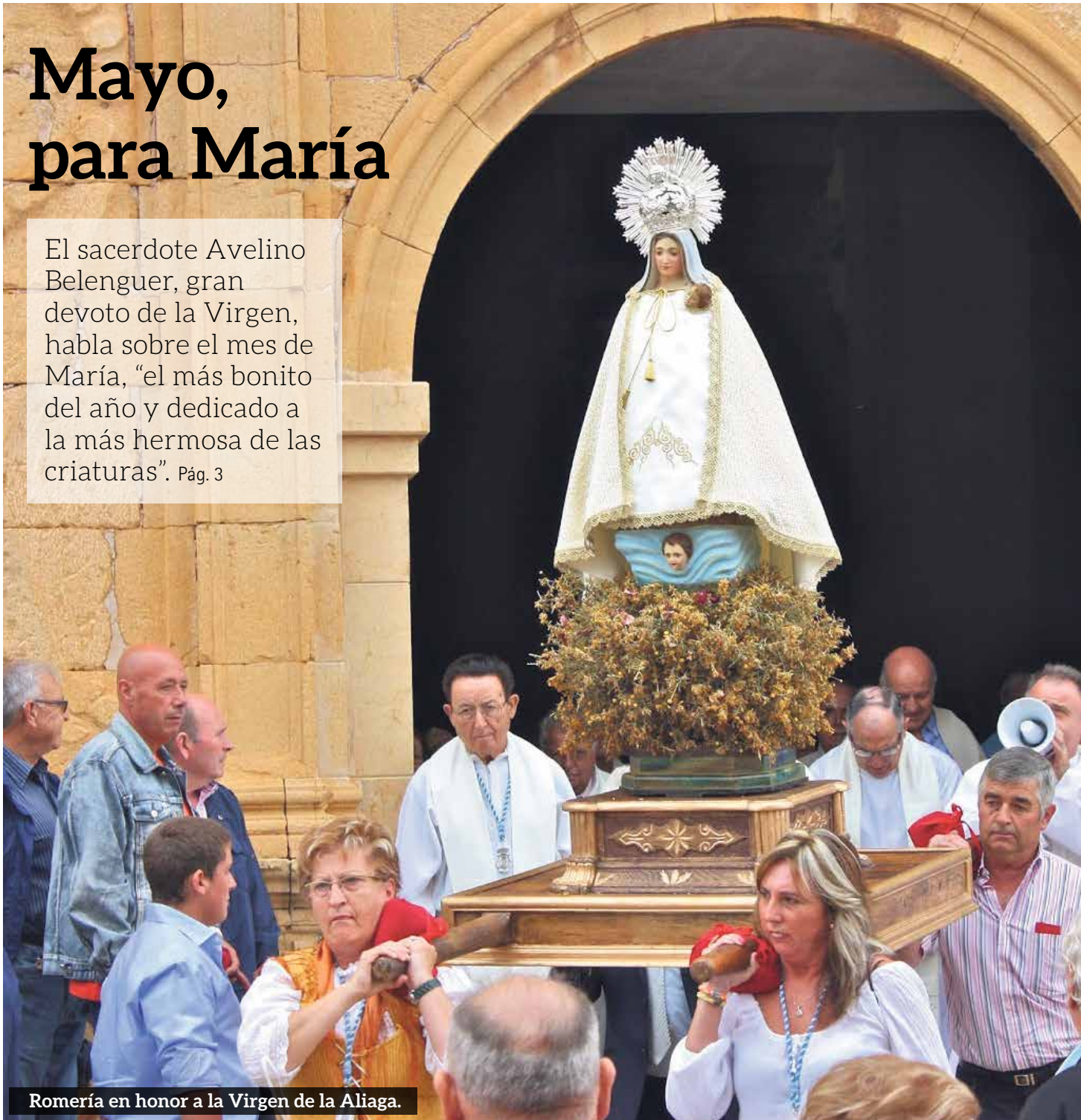
Romería en honor a la Virgen de la Aliaga.