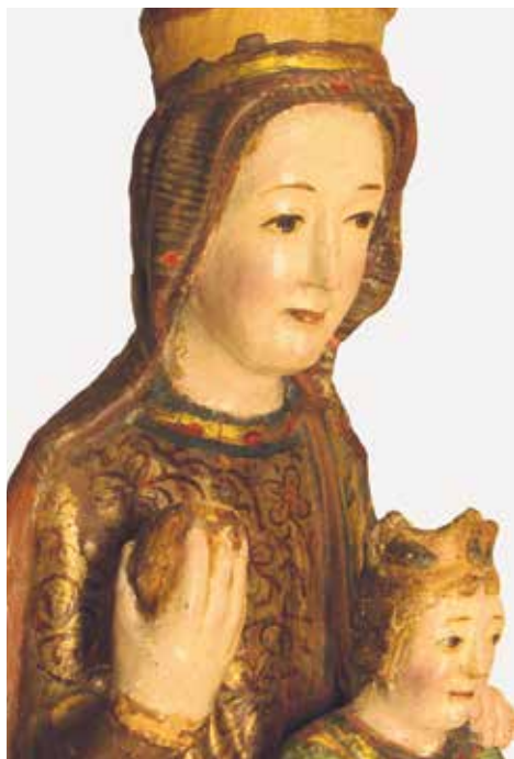
Talla de la Virgen de Arbués.

Románico. Siglo XIII. Madera tallada, dorada y policromada. Procede de la iglesia parroquial de San Pedro Apóstol de Arbués.