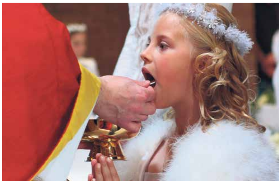
Hay que unir familia, parroquia y escuela, para lograr la adhesión al Señor en la cotidianidad.