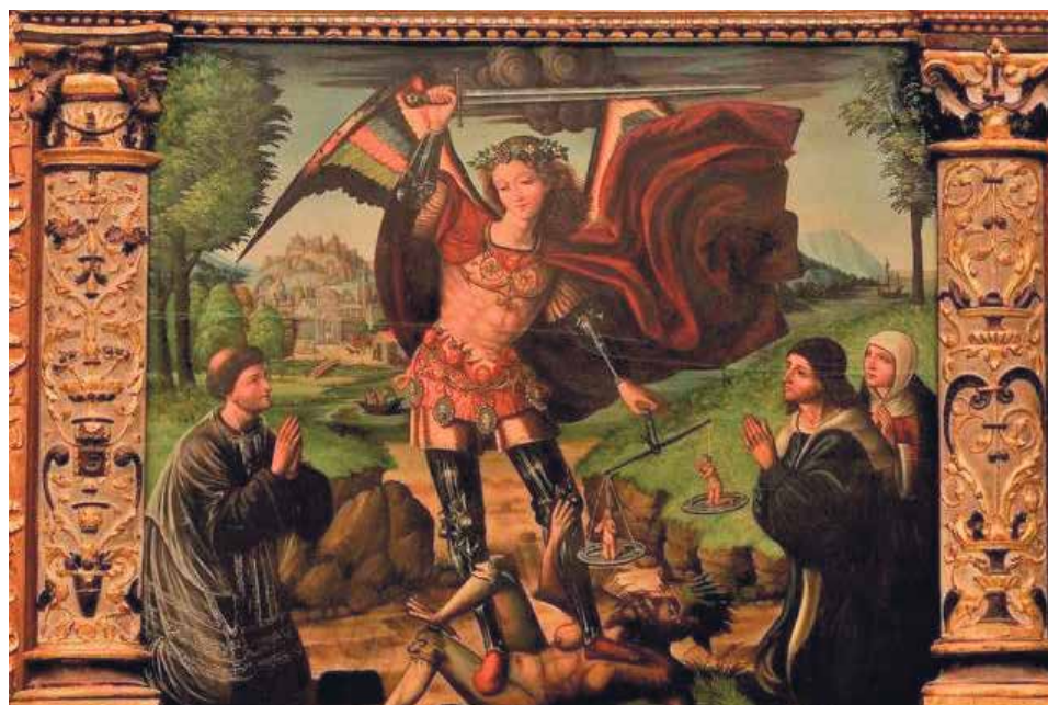
Retablo de San Miguel Arcángel de Abanto, de la parroquia de la Asunción de la Virgen.

Entre las obras expuestas destacan piezas como el retablo de Santa María la Mayor de Tosos (1457-