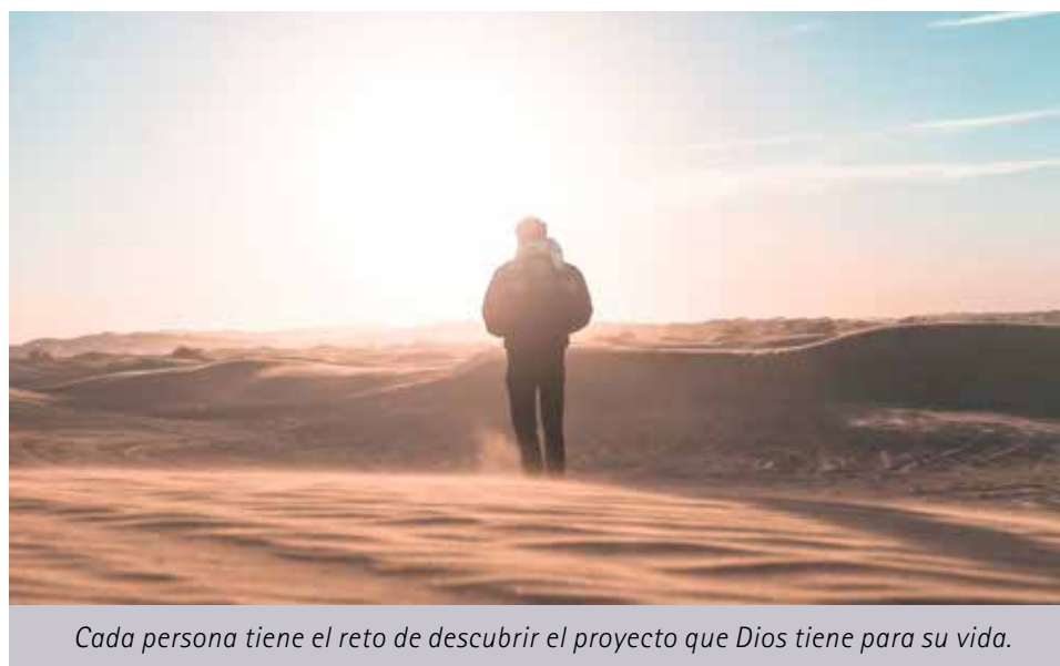
Cada persona tiene el reto de descubrir el proyecto que Dios tiene para su vida.

“Como en la historia de toda llamada, también en este caso se produce un encuentro. Jesús camina, ve a esos pescadores y se acerca...”, continúa Francisco. “Así sucedió con la persona