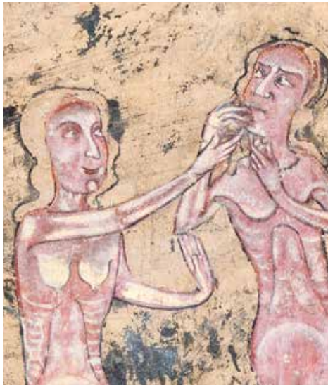
Adán y Eva.

Hacia 1310-1330. Iglesia de San Esteban en Urriés (Zaragoza)