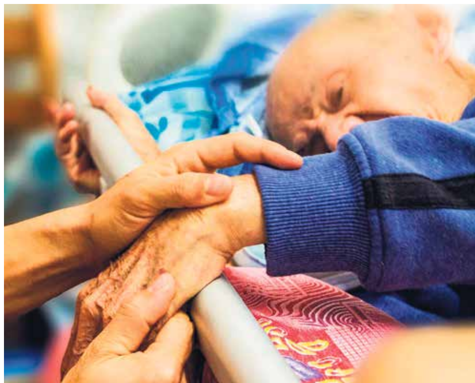
La alegría del Evangelio debe alcanzar a quienes viven el sufrimiento y la postración.

En esta primera entrega se aborda el capítulo inaugural: eutanasia, suicidio asistido y muerte digna.