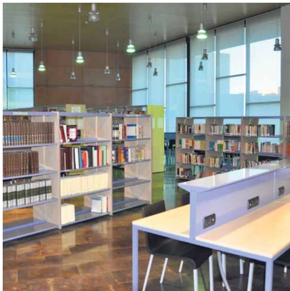
Los cursos especiales del CRETA comienzan el próximo lunes 3 de febrero.