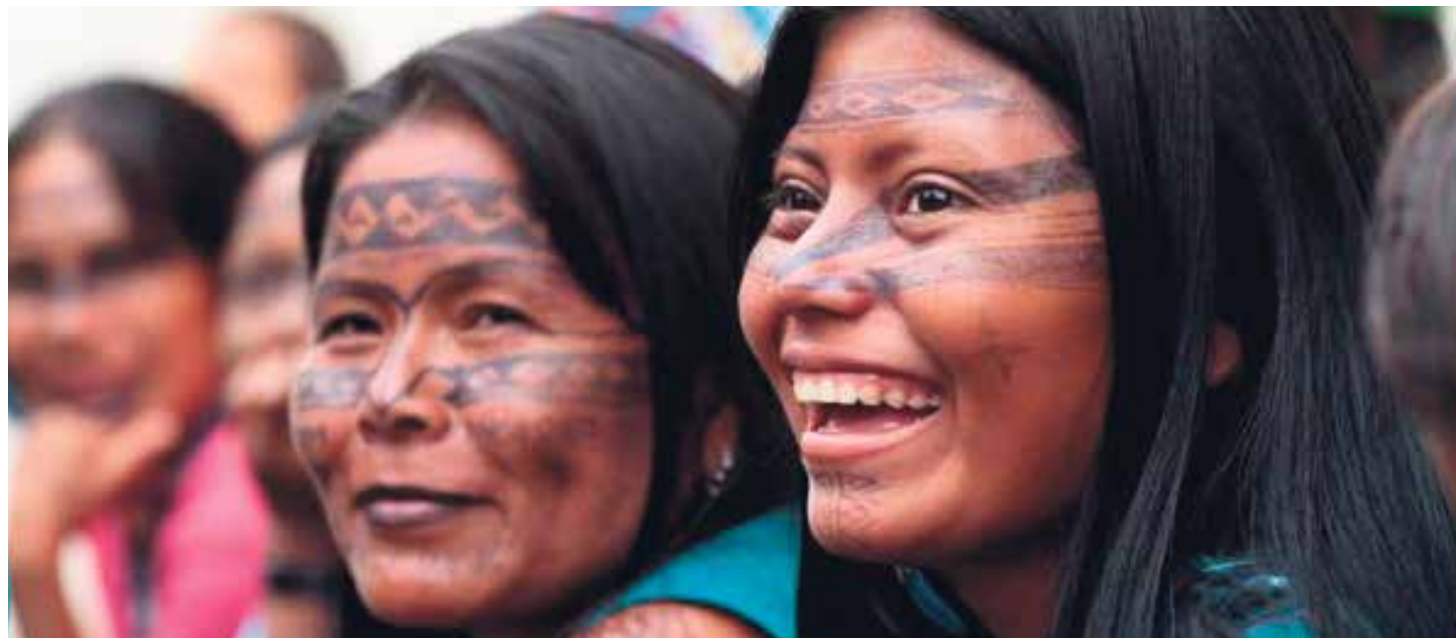
El Papa llama a reconocer el servicio genuino de las mujeres, evitando clericalizarlas.

En su exhortación apostólica postsinodal 'Querida Amazonia', publicada el 12 de febrero, el papa Francisco asegura que sin las mujeres la Iglesia “se derrumba”, destacando que ellas “hacen su aporte a la Iglesia según su modo propio y prolongando la fuerza y la ternura de María, la madre”. Les ofrecemos estos textos, comprendidos entre los números 99 y 103: