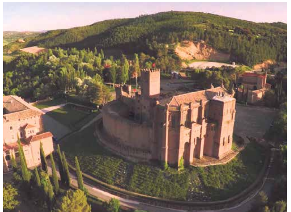
Castillo de Javier.

Fecha: Sábado, 14 de marzo 12.00: Leyre – Liédena. Comida de alforja. Lema: Cada paso cuenta 15.00: Viacrucis, Sangüesa –Javier Programa: 17.00: Misa en la explanada de Javier 9.45: Salida de Sabiñánigo 19.00: Retorno a Jaca y Sabiñánigo. 10.00: Salida de Jaca Inscripción: En las parroquias