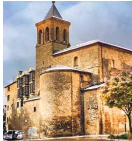
Monasterio de Benedictinas de Jaca

Se ha programado un retiro espiritual para laicos bajo el lema: Él vive y te quiere vivo.