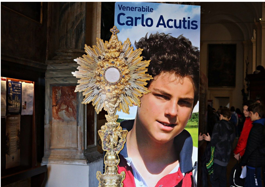
El italiano Carlo Acutis, beatificado el 10 de octubre, inspira a miles de jóvenes.