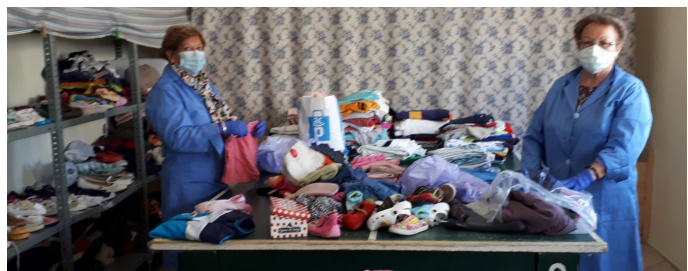
Ropero de Cáritas Sabiñánigo.

Su misión será conversar, pasear, jugar al ajedrez o a las cartas, leer, o realizar otras actividades que fomenten una amistad entre el voluntario y la persona