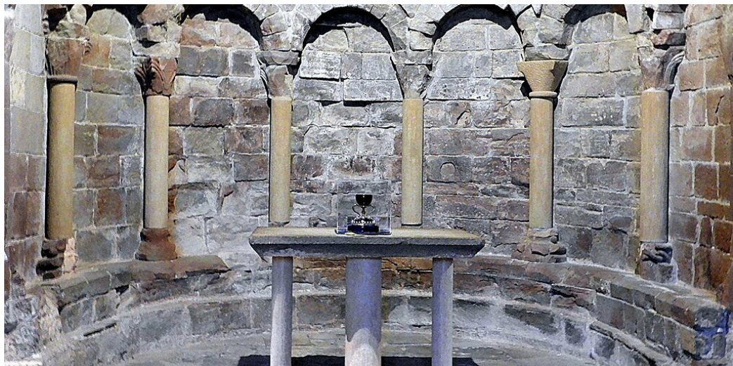
Réplica del Santo Grial en el altar mayor de San Juan de la Peña.