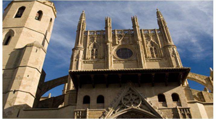
Imagen de la catedral de Huesca.