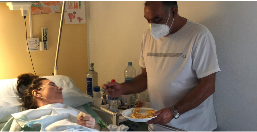
Los voluntarios de pastoral de la Salud, siempre con una mano tendida, brindan un apoyo clave.

Subrayan el servicio "generoso y heroico" durante la pandemia