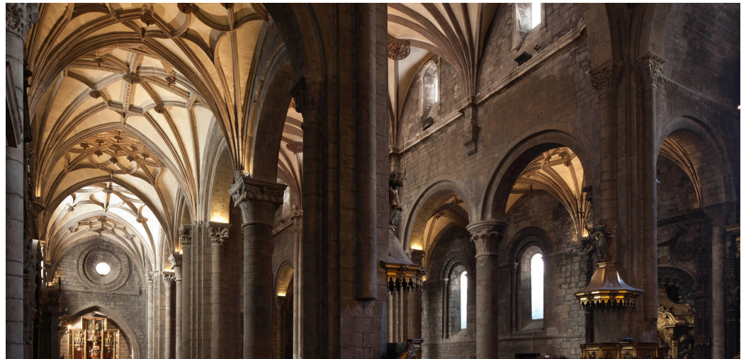
Naves de la Catedral de Jaca.

Aunque la datación del inicio de las obras de la seo jaquesa sigue resultando polémica, los investigadores barajan un intervalo de fechas comprendido entre las décadas de 1060 y 1070. En ese momento se construían también cinco grandes templos franceses e hispanos asociados al Camino de Santiago: Saint Sernin de Toulouse, Sainte Foy de Conques, Saint Martial de Limoges, Saint Martin de Tours y Santiago de Compostela. Estas iglesias tenían numerosas soluciones arquitectónicas en común, como el uso de bóvedas de cañón con fajones, la presencia de tribuna en la nave central y el desarro-