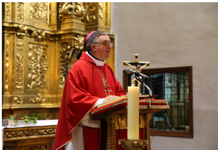
Monseñor Gómez Cantero agradece la entrega de todo el pueblo de Dios.

El prelado, que el 21 de enero cumple cuatro años en la diócesis de Teruel y Albarracín, estará en Almería desde la primera semana del mes de marzo