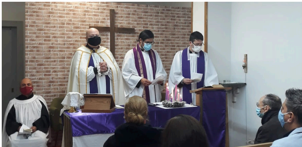
Inauguración de la parroquia anglicana de San Jorge el 13-12-2020.