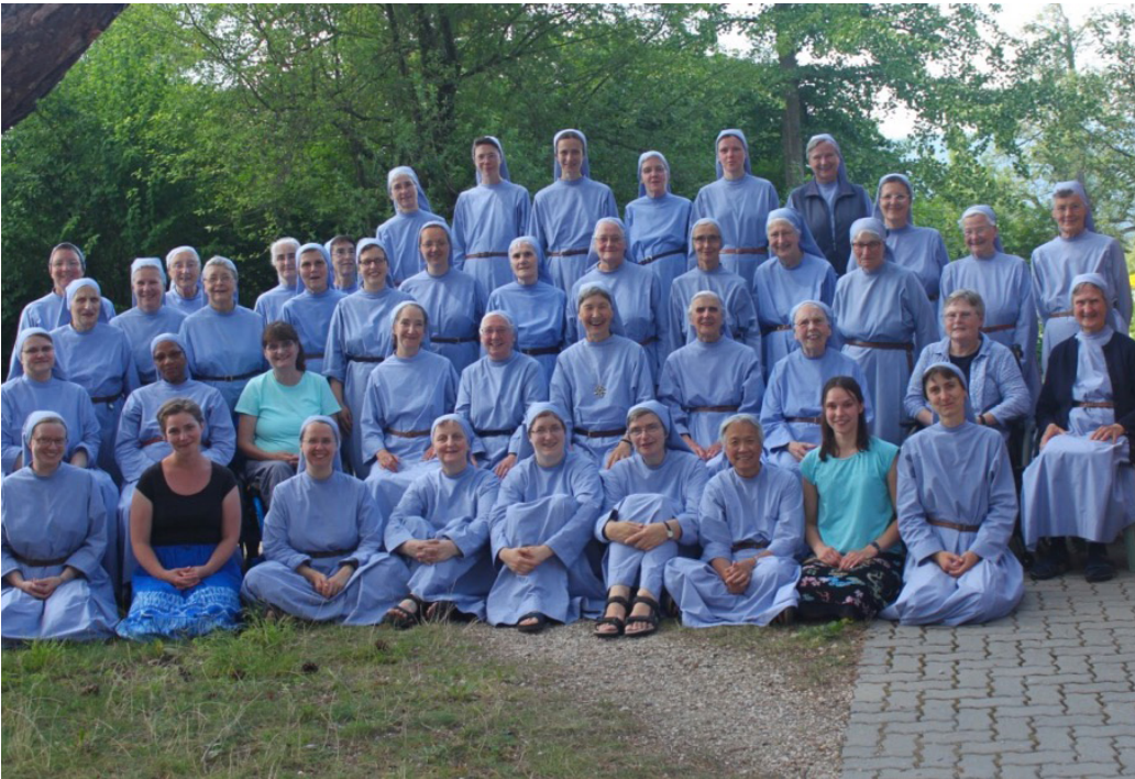
Comunidad monástica de Grandchamp (Neuchatel. Suiza).