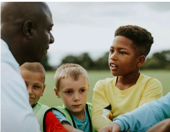
Fotograma del último video del Papa.