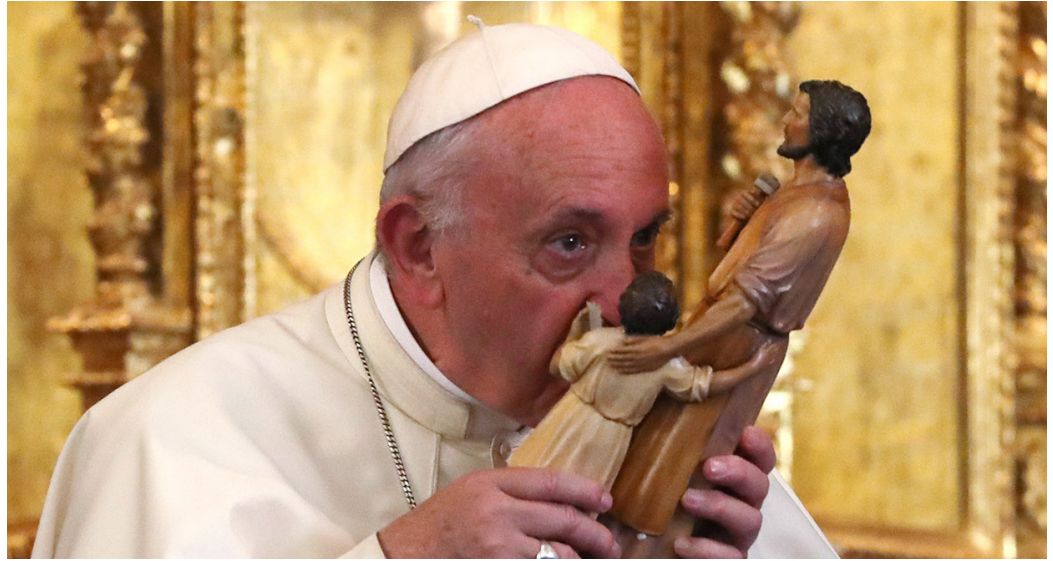
La confianza de Francisco a san José le lleva a confiarle todas las dificultades.

Las invocaciones añadidas, aprobadas por el papa Francisco, son las siguientes: «Custodio del Redentor» (cf. san Juan Pablo II, exhort. apost. Redemptoris custos); «Servidor de Cristo» (cf. san Pablo VI, homilía del 19.III.1966,