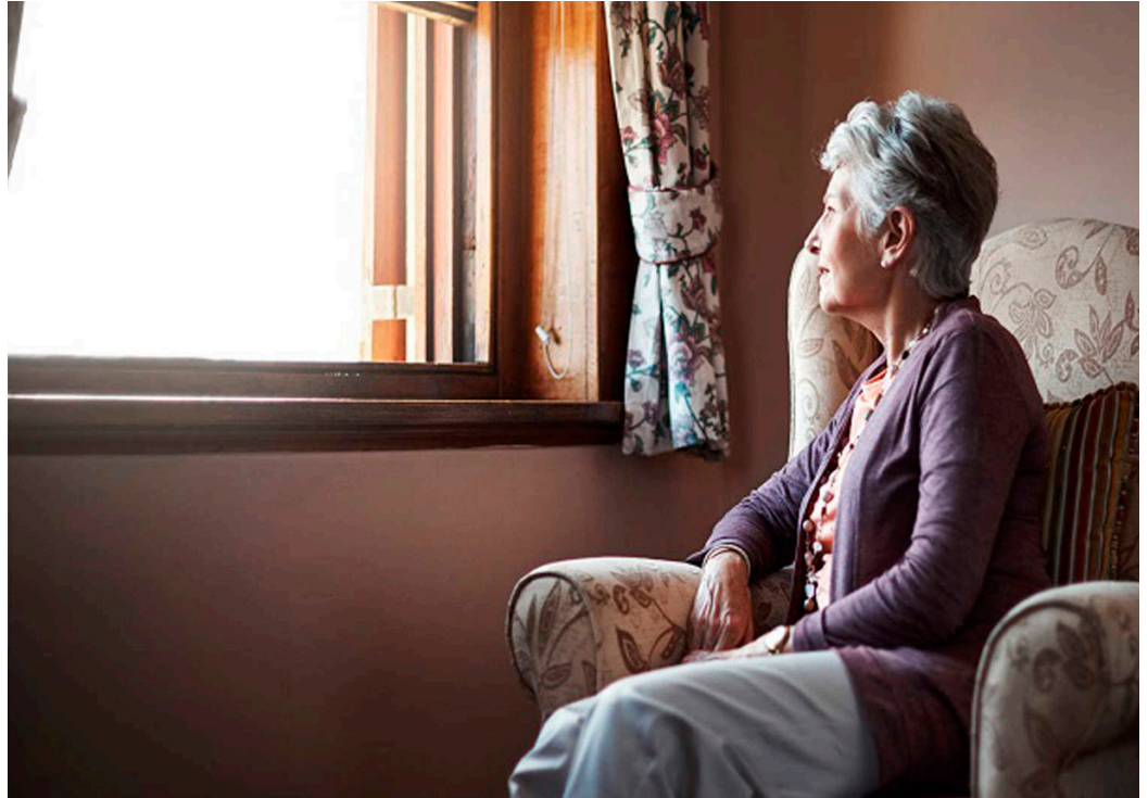
La soledad de los mayores, epidemia en expansión.

Podemos distinguir entre diferentes tipos de soledad. Se puede estar solo y disfrutando mientras se lee un libro o escucha una pieza maravillosa de música, mientras se medita, se piensa. A la par, la soledad se puede experimentar como sentimiento. Muchas personas empiezan a sentir que no pueden soportar más la soledad, que “se les cae la casa encima”, que se sienten solos. Se sienten apartados del contacto