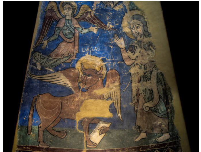
Fresco con San Rafael. Navasa.

bre significa "Dios cura". En este texto se nos cuenta que el joven Tobías, hijo del ciego Tobit, dejó su casa para viajar hasta el hogar de su amada Sara y casarse con ella. En el camino se le apareció San Rafael bajo la apariencia de un viajero en busca de trabajo, y se ofreció como guía a Tobías. Durante su viaje, Tobías pescó un pez, y San Rafael le ordenó que guardase la hiel, el hígado y el corazón del animal porque "sirven para la medicina". De este modo, el arcángel no solo consiguió que Tobías llegase sano y salvo a casa de Sara, sino que a la vuelta el joven le devolvió la vista a su padre Tobit al untarle la hiel del pez en los ojos por recomendación del arcángel Rafael. En virtud de estos motivos, San Rafael es el patrón de la medicina, pero también de los enamorados y de los viajeros. Es por ello que muchos peregrinos tienen especial devoción a este arcángel, que se presenta en la Biblia como buen amigo y protector de aquellos que inician un viaje movidos por su fe y sus buenas acciones.