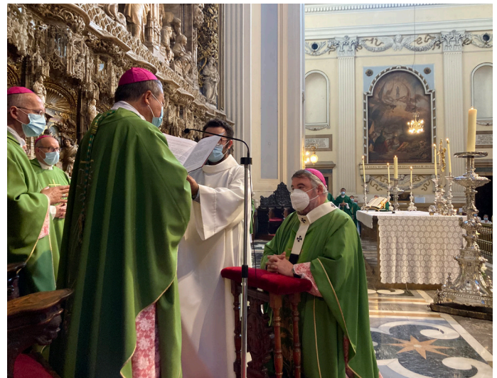
El Nuncio impuso el palio a don Carlos en nombre del papa Francisco.