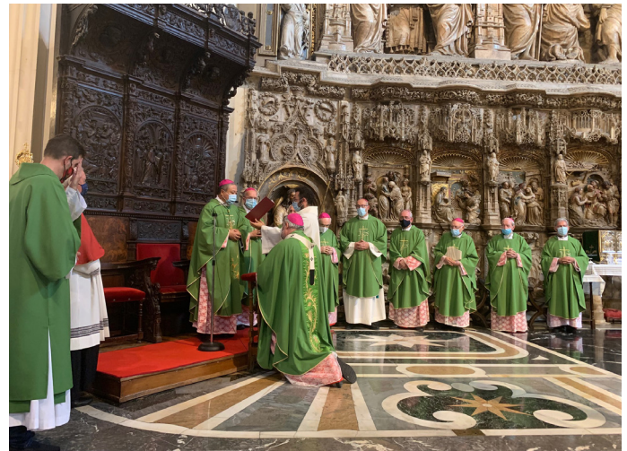
La imposición del palio tuvo lugar al principio de la misa estacional.

La lana significa la aspereza de la reprensión a los rebeldes; el color blanco, la benevolencia hacia los humildes y penitentes. La forma circular que encierra los hombros es el temor del Señor. Como destacó el Nuncio en su alocución inicial, «el hecho de que el palio esté tejido con lana de oveja y se coloque sobre los hombros es un signo elocuente del Buen Pastor que carga con la oveja perdida».