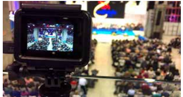
El encuentro da continuidad al Congreso de Laicos de 2020.

■ La Comisión Episcopal para los Laicos, Familia y Vida reúne los días 23 y 24 de octubre a los delegados de Apostolado Seglar, a los responsables de movimientos y asociaciones de laicos y a los responsables diocesanos del Sínodo de los Obispos en unas jornadas que tendrán lugar en el Aulario Papa Francisco de Madrid.