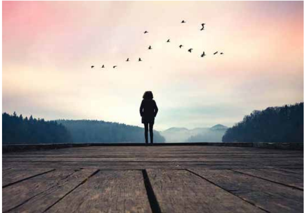
La soledad exterior permite entrar en el interior de uno mismo.

Por este motivo, cuando el sentimiento de soledad hace acto de presencia en la vida, debe poder verse como una oportunidad para poderse conocer y adentrarse dentro de