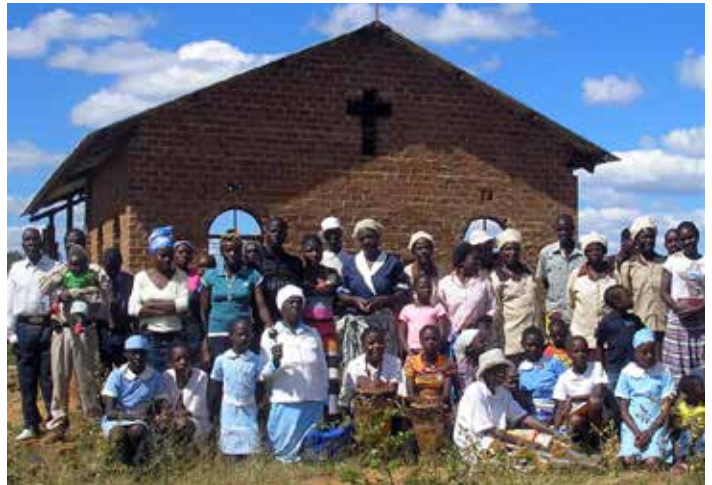
El Domund ayuda a visibilizar el trabajo de los misioneros.

El domingo 24 de octubre se celebra el Domund en todo el mundo para apoyar a los misioneros en su labor evangelizadora. Este año le acompaña el lema: "Cuenta lo que has visto y oído".