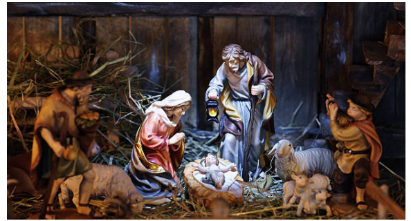
El Belén enmarca el misterio de la Encarnación de Dios.

■ La hermosa tradición de preparar el Belén los días previos a la Navidad se remonta al año 1223. Cuando San Francisco de Asís, después de su viaje a Tierra Santa, quiso celebrar la memoria del Niño Dios y representar la Natividad. “San Francisco realizó una gran obra evangelizadora con la simplicidad de aquel signo”, escribió el papa Francisco en la carta apostólica Admirabile signum . El nombre del “Belén” proviene de la localidad palestina donde nació Jesús de Nazaret, como evidencian los Evangelios de San Lucas y de San Mateo.