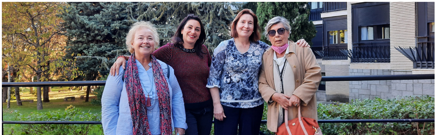
En la Asamblea General de Manos Unidas.

Los pasados días 22, 23 y 24 octubre, en el Escorial, se celebró la primera asamblea general presencial de delegadas, celebrada después de la pandemia. Asistimos de Aragón las delegaciones de Zaragoza, Teruel, Tarazona y Jaca. Huesca y Barbastro