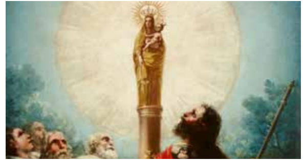
La primera aparición mariana de todos los tiempos.

■ El comienzo de año en la Iglesia zaragozana viene siempre marcado por la figura de Santa María. El día uno, con toda la Iglesia, celebramos la Solemnidad de Santa María, Madre de Dios. Y al día siguiente la tradicional y zaragozana fiesta de la Venida de la Virgen. María fue elegida desde el principio de los tiempos para ser la Madre del Hijo del Padre eterno, por eso Dios la enriqueció con multitud de gracias especiales. La hizo inmaculada, la llenó de gracia y la llevó consigo en cuerpo y alma a la gloria de los cielos. María vivió en una constante apertura a Dios y a su Palabra y supo descubrir a Dios en los diversos acontecimientos de su