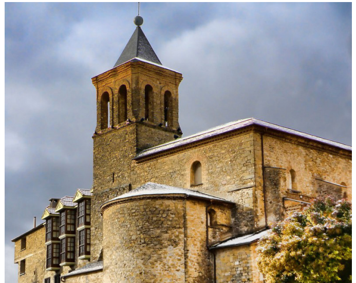
Monasterio de las benedictinas de Jaca.