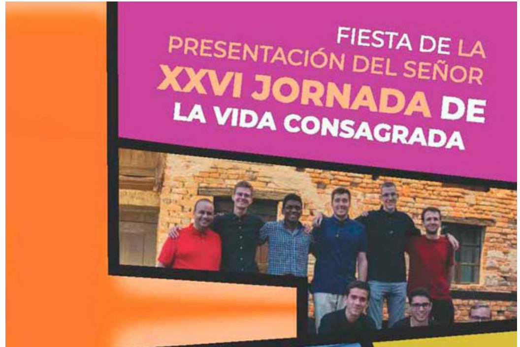
Cartel de la Jornada.

En muchos casos antes de la invasión musulmana, hubo