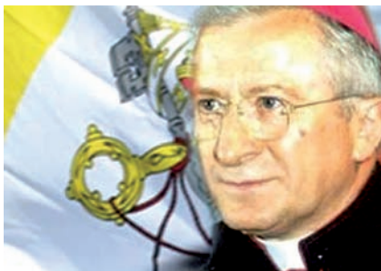
Cardenal Ennio Antonelli, que presidirá las sesiones del Congreso.

Como ya conocen nuestros lecto- res, esta semana tiene lugar en Zara- goza un importante evento social y religioso: El Congreso “Ayudar a la familia hoy”, cuyas sesiones se desa- rrollarán los días 10, 11 y 12 de di- ciembre en la Sala CAI Luzán del paseo Independencia núm. 10, que cuenta con ponentes de primer nivel. El programa de conferencias y mesas redondas lo publicó esta Hoja Dioce- sana la semana pasada en las páginas centrales. El sábado día 11, a las sie- te de la tarde, pronunciará la lección de clausura el Emmo. y Rvdmo. Cardenal Ennio Antone- lli, presidente del Pontificio Consejo para la Familia.