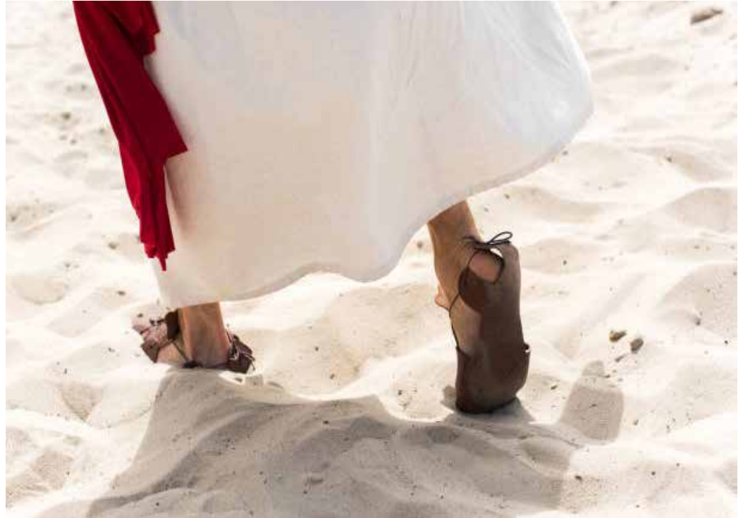
Jesús permaneció 40 días solo en el desierto, donde venció las tentaciones del demonio.

La duración de la Cuaresma de 40 días está basada en los siguientes hechos que acontecen en la Biblia: cuarenta días del diluvio, de los cuarenta años de la marcha del pueblo judío por el desierto, de los cuarenta días de Moisés y de Elías en la montaña y los 40 días en los que Jesús permaneció solo en el desierto de Judea. El Espíritu Santo llevó a Jesús hasta ese extenso lugar de 1.500 kilómetros, lleno de yacimientos arqueológicos,