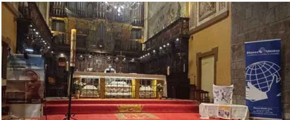
Misa de Pascua.