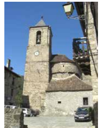
Iglesia de Hecho.