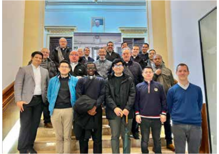
Los sacerdotes jóvenes visitaron Alma Mater Museum en Zaragoza.

En el encuentro participaron treinta y seis sacerdotes jóvenes pertenecientes a cuatro Diócesis de Aragón: Zaragoza, Teruel y Albaracín, Barbastro-Monzón y Tarazona.