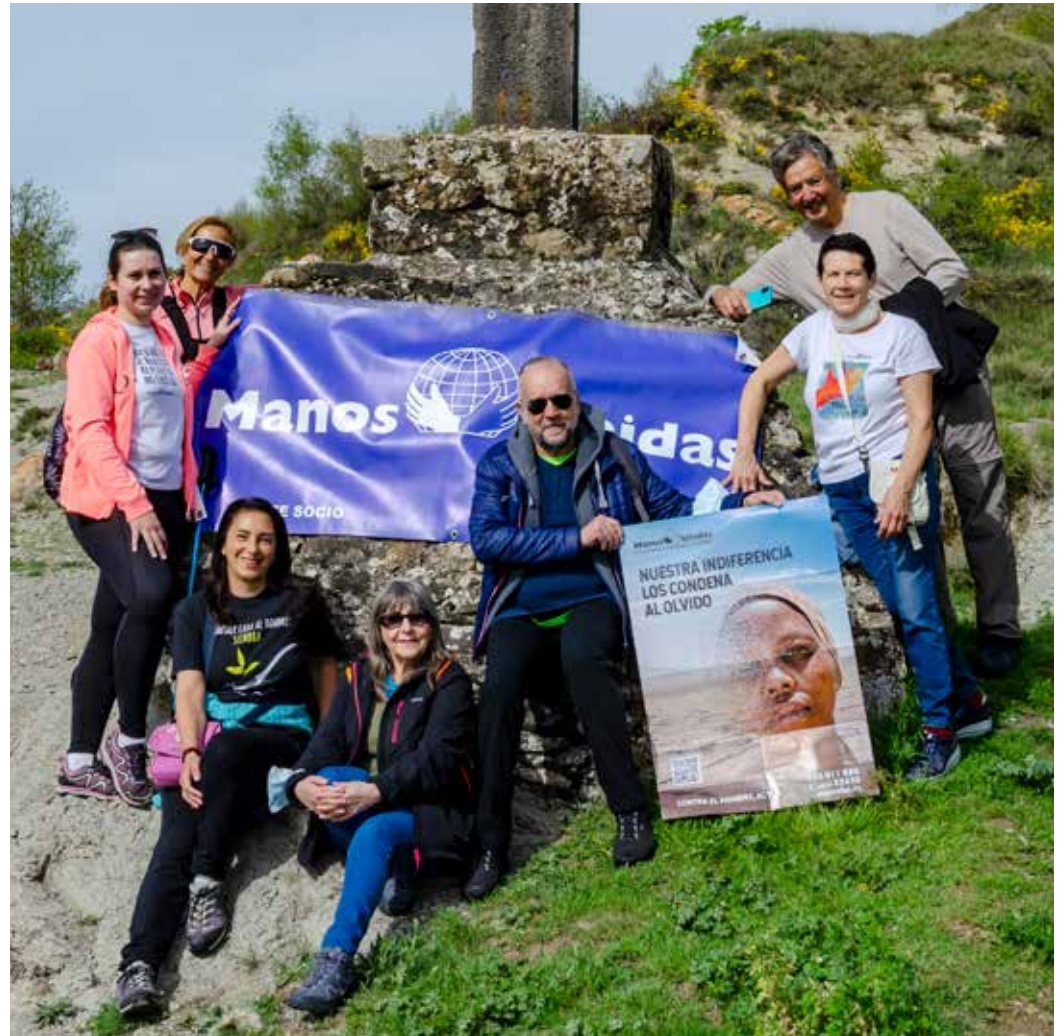
Manos Unidas Jaca junto a la Cruz del Camino situada en Jaca.

Desde las distintas delegaciones de Manos Unidas de Aragón, junto con su consiliario correspondiente, el 3 de mayo se dieron cita en torno a una Cruz para rememorar la salvación que nos trae Cristo con su crucifixión. Primero, realizaron un pequeño acto que comenzó con una oración y, después, tomaron una fotografía junto a una cruz emblemática de la ciudad: El Cristo de la Paz en El Santo Sepulcro de Calatayud; la Cruz de la plaza de Santa Cruz en Zaragoza, la Cruz del Camino en Jaca; la Cruz de la plaza del Seminario en Teruel; la Cruz en el Monasterio de El Pueyo en Barbastro y la Cruz del convento de San Miguel, las Miguelas, en Huesca. El año pasado realizaron una actividad similar pero con las cruces situadas en los montes y en las cumbres. Con este acto pretenden visibilizar la