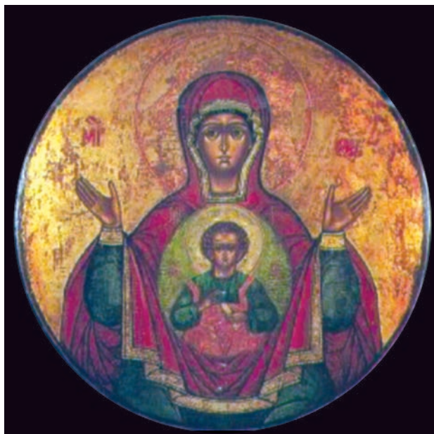
El día 1 de enero se celebra la solemnidad de Santa María, Madre de Dios y la Jornada Mundial de la Paz. SANTO Y FELIZ AÑO NUEVO.

"Nunca hemos sido simplemente 'un grumo de material biológico' --añade--. Siempre hemos sido, desde el comienzo, un proyecto concreto que se iba desarrollando hacia la inteligencia, la libertad y el amor, abierto a lo verdadero, lo bello, lo bueno, a lo infinito. Un proyecto que, a su vez, só-