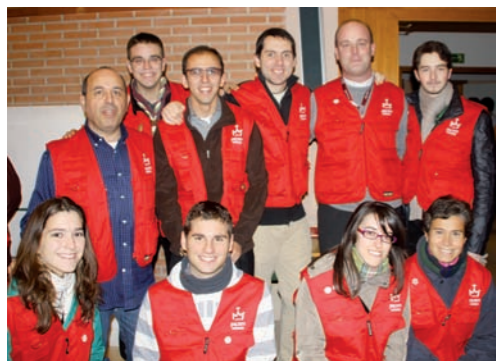
Voluntarios y Comisión de la JMJ

La acogida no fue más que el comienzo de una semana llena de emociones recorriendo los espacios más emblemáticos de la Diócesis. Los actos con ocasión de la visita de la cruz y el icono han reunido a cerca de 1.000 es-