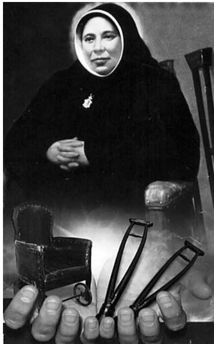
Santa Genoveva Torres Morales (1870-1956), Fundadora de las Angélicas.