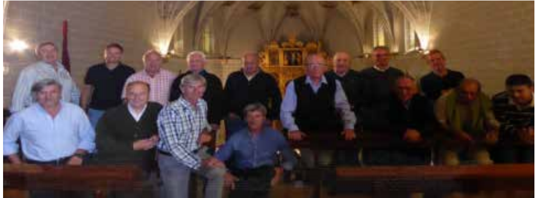
Coro de Sallent de Gállego.

servado, excepcionalmente, en esta villa, de padres a hijos, por transmisión exclusivamente oral, durante más de cinco siglos y del que los sallentinos se sienten orgullosos. Algunas de sus canciones, sobre todo las que componen la Misa solemne, frecuentemente denominada "Misa de Sallent", pueden tener, según algunos investigadores de Música Antigua, ascendencia Visigoda o Mozárabe, que se concentraron en los Pirineos, al amparo del monasterio San Juan de la Peña. Aquí, en Sallent, se ha logrado conservar a través de los tiempos, convirtiéndonos, podríamos afirmar,