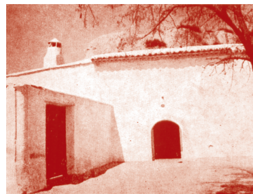
Cueva en que vivió Poveda

Ordenado sacerdote en Guadix, el 17 de abril de 1897, comprometió su vida apostólica en el barrio gitano de las cuevas de dicha ciudad, especialmente con los niños; para ellos creó las primeras escuelas.