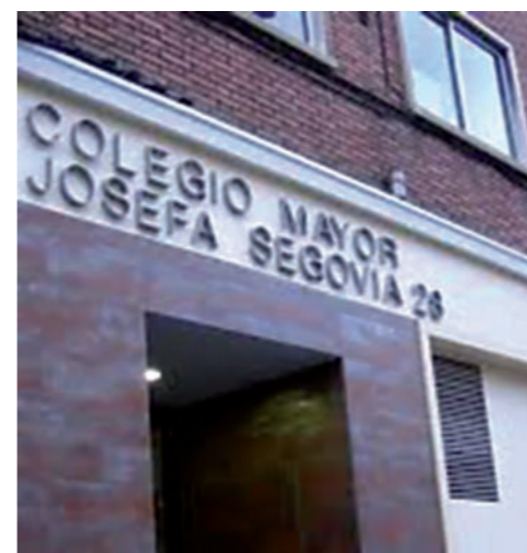
Fachada del Colegio Mayor Universitario Josefa Segovia en Zaragoza