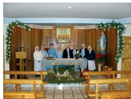
Hijas de la Caridad