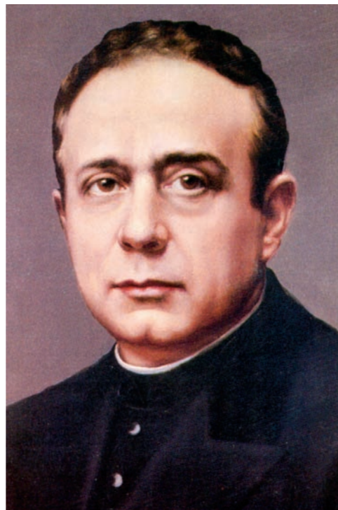
San Pedro Poveda Castroverde (1874-1936)

Como San Pedro Poveda queremos actuar: • en las entrañas de la cultura y de las culturas,