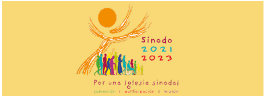
Logo del Sínodo.

«Después de leer el Documento de la etapa continental en un clima de oración, ¿qué intuiciones resuenan más fuer-