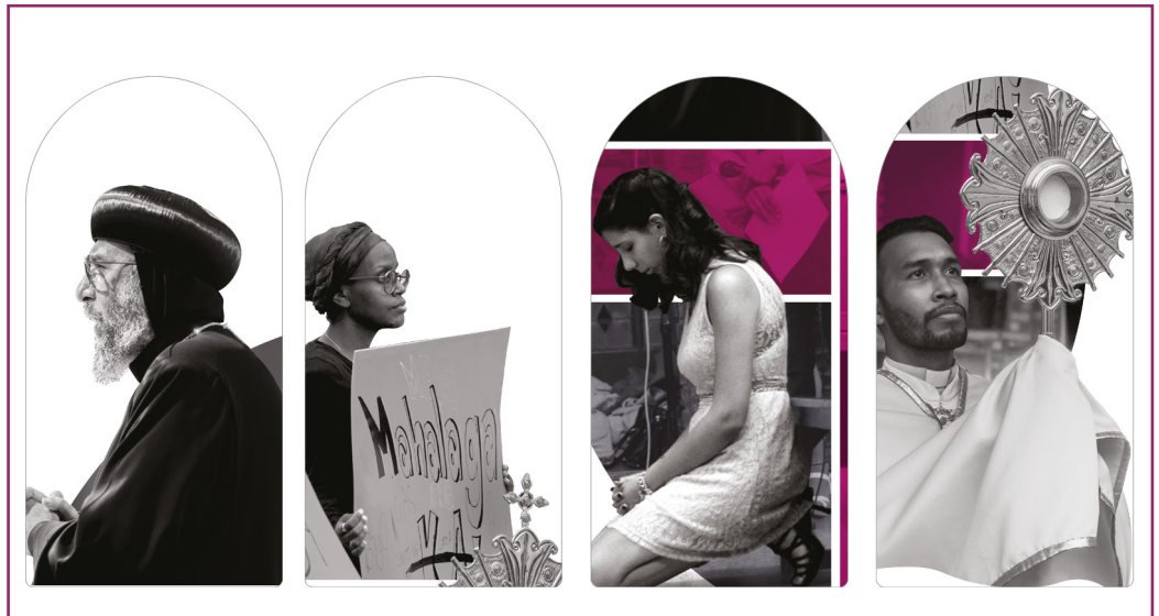
Las cuatro imágenes del cartel destacan la interracialidad, gran protagonista de la Semana de este año.

Una manera de favorecer la unidad entre los cristianos es trabajar juntos por la justicia, cooperando en acciones que hagan patente el deseo de paz y de unidad que brota de la fe en Jesucristo. Hay muchos ámbitos en los que podemos trabajar junto a otros cristianos: la atención a los más pobres, la defensa de la mujer, la lucha