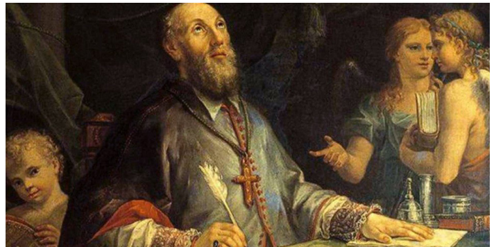
San Francisco de Sales.