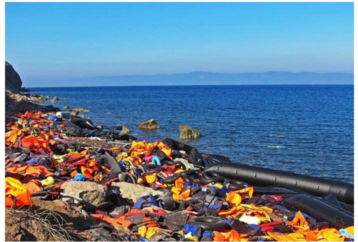
Restos del naufragio en el mar Jónico.

Con motivo del 20-J, Día Mundial de las personas refugiadas, y próximos al primer aniversario de la tragedia en la frontera de Melilla, como pide el papa Francisco haciéndose eco del Evangelio, reiteramos nuestro compromiso con la acogida, protección, promoción e integración de refugiados y migrantes.