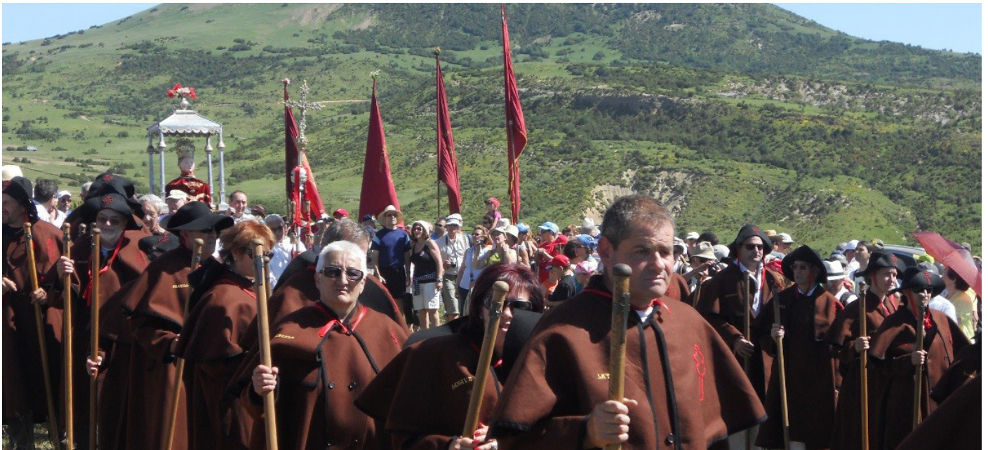
Romeros de la Cabeza en el Puerto de Santa Orosia.