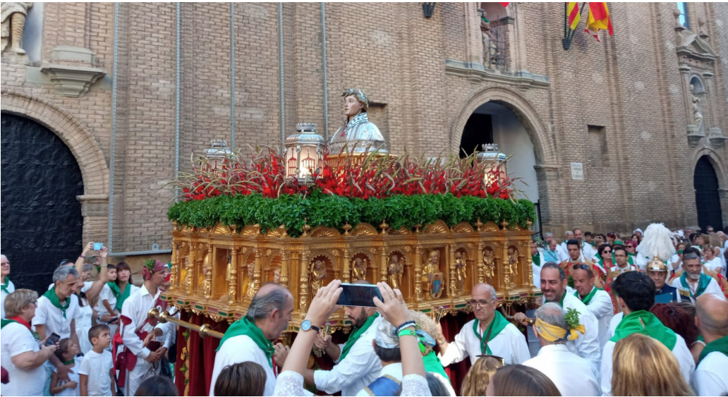
La procesión del 10 de agosto con el busto de san Lorenzo representa uno de los momentos más emotivos.