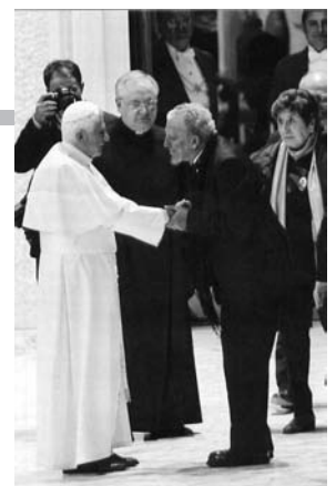
Benedicto XVI saluda a los dirigentes del Camino, los españoles Kiko Argüello y Carmen Hernández.

Que os sostenga también mi bendición, que os imparto de todo corazón a vosotros y a todos los miembros del Camino Neocatecumenal diseminados por el mundo" (17.1.2011).