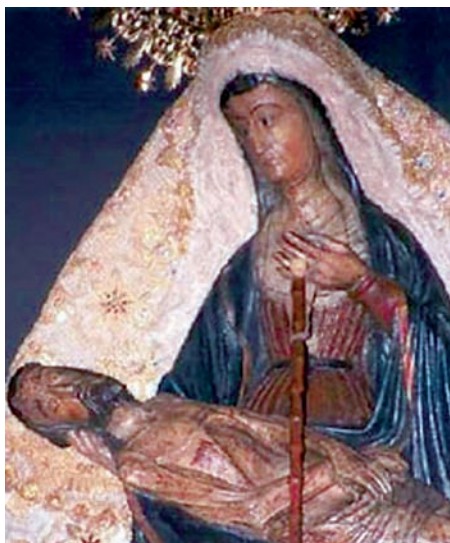
Imagen de Ntra. Sra. de África.

Por su parte, los obispos de la Conferencia Episcopal de la Región Norte de África, reunidos en Argel del 29 de enero al 2 de febrero pasado, reconocen en un comunicado que en los recientes acontecimientos hay “una reivindicación de libertad y de dignidad, que se tradu-