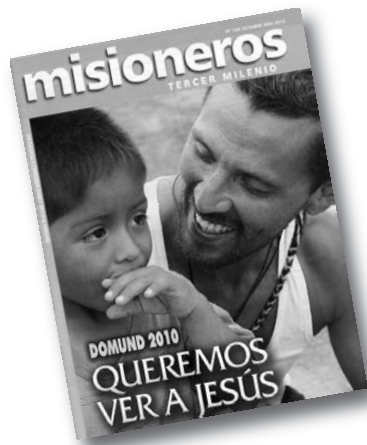
Revista “Misioneros Tercer Milenio”, editada por las Obras Misionales Pontificias.