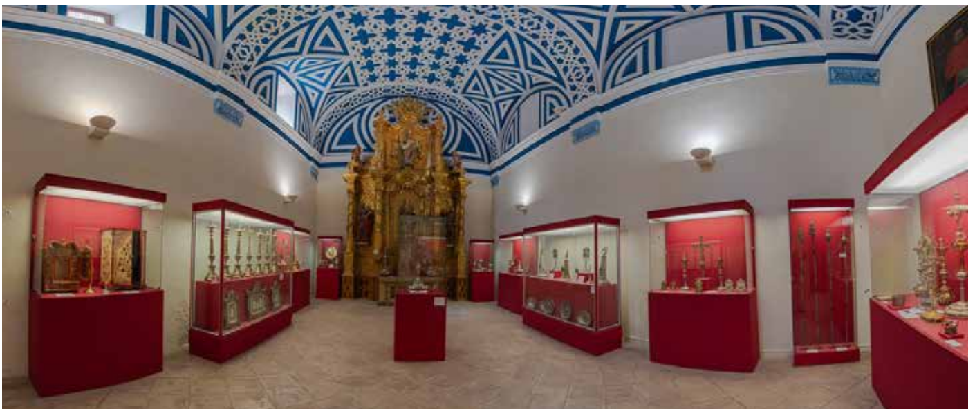
Muestra general del recientemente inaugurado Museo de Arte Sacro de Calatayud.

Por primera vez, los museos de arte sacro de Aragón se han unido para organizar una exposición conjunta bajo el mismo nombre -Exemplum- y con la misma motivación: rescatar las reliquias y relicarios como herramientas de evangelización.