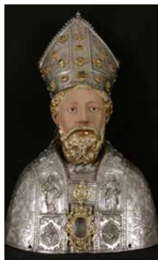
Busto de San Ramón en el Museo Diocesano de Barbastro-Monzón

La exposición puede visitarse hasta el día 17 de diciembre en los Museos Diocesanos.