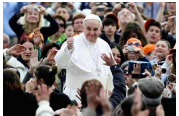
Francisco durante un encuentro con los jóvenes

«Alegres en la esperanza es una exhortación de san Pablo a la comunidad de Roma, que se encuentra en un período de dura persecución», recuerda el papa. Una alegría, subraya, «que brota del misterio pascual de Cristo, de la fuerza de su resurrección. No es fruto del esfuerzo humano, del ingenio o del arte. Es la alegría que nace del encuentro con Cristo. La alegría cristiana viene de Dios mismo, del sabernos amados por Él».