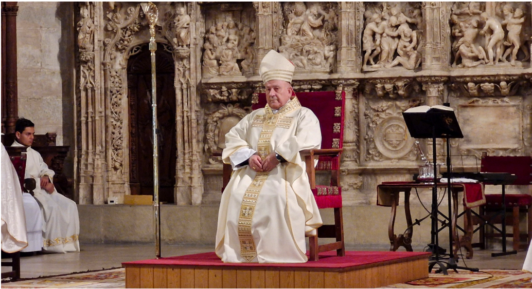
Don Vicente Jiménez celebró su primera eucaristía como administrador apostólico de Huesca el 7 de enero.