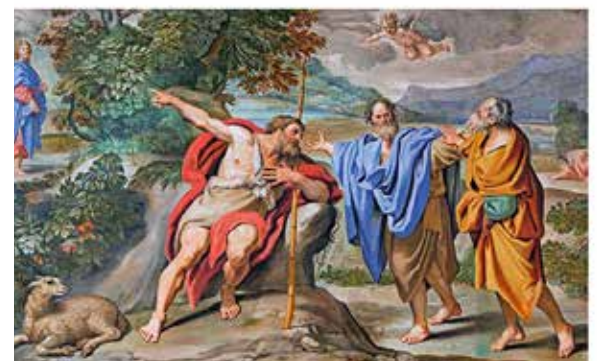
Detalle de la cubierta del nuevo Catecismo de adultos.

CATECISMO PARA EL CATECUMENADO DE ADULTOS Y LA REVITALIZACIÓN DE LA VIDA CRISTIANA