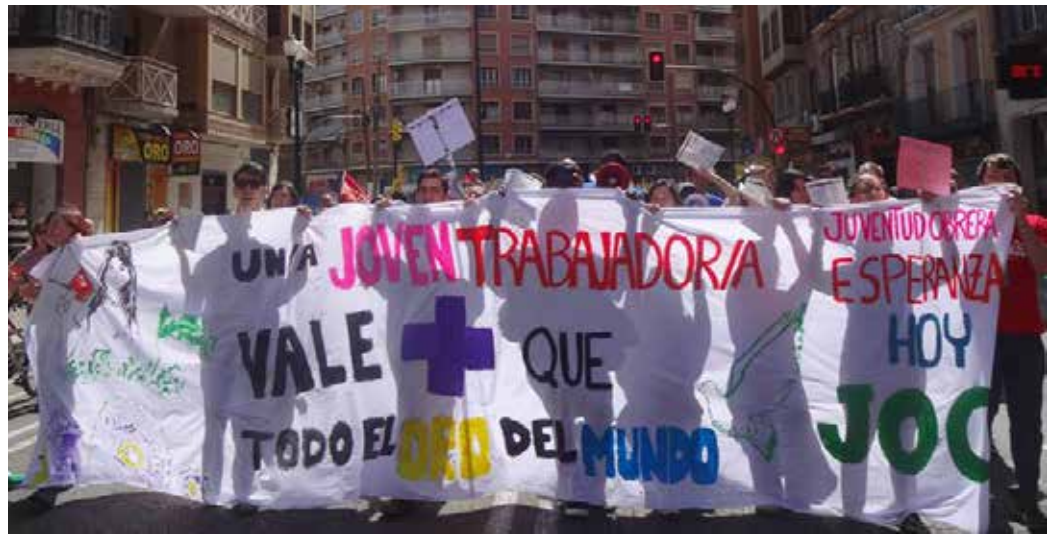
Integrantes de la JOC en una manifestación en Zaragoza.