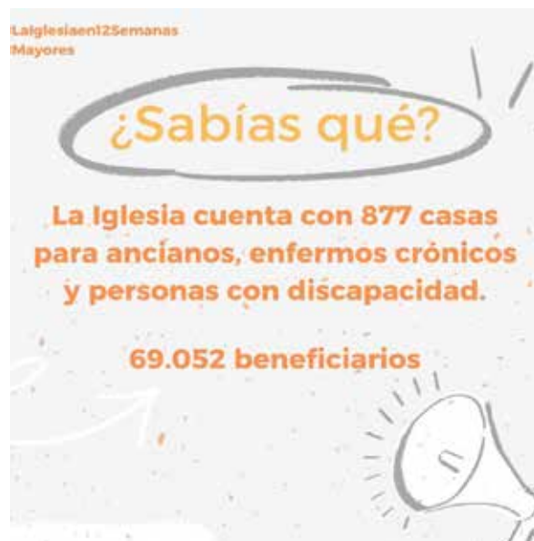
Imagen de la publicación correspondiente a la semana 3.