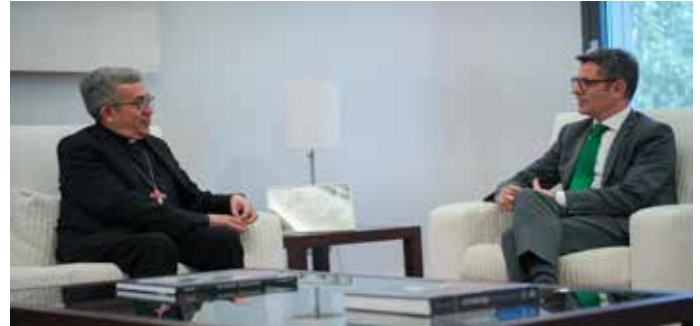
El Pte. de la CEE, Luis Argüello, en su última reunión con el ministro de Presidencia, Félix Bolaños