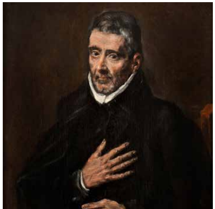
Retrato de San Juan de Ávila atribuido al Greco. Toledo

■ Viernes, 10: Fiesta de San Juan de Ávila, patrón del Clero Secular Español en Castiello de Jaca. A partir de las 12 h. Visita guiada a la iglesia de Castiello con motivo de las últimas restauraciones, eucaristía y comida fraterna.