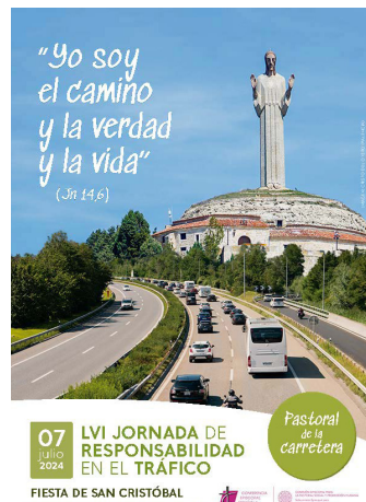
Cartel de la jornada.