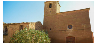
Torres de Barbués.