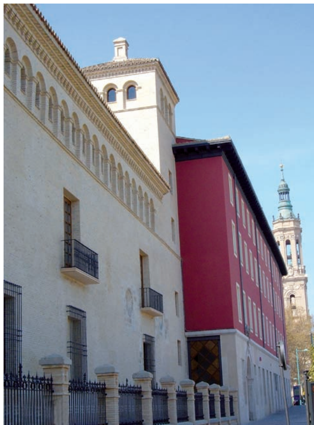
Fachada norte del Palacio (entrada al Museo) con el emblemático Torreón, y la basílica del Pilar al fondo.

Nuestra generación tiene la oportunidad de descubrir lo que no fue posible a las anteriores: visualizar en el mismo lugar las distintas culturas que se han sucedido en nuestra ciudad desde que en ella se establecieron los romanos. Hay restos de la muralla y sus torres, de la cloaca y de la calzada. El espacio era parte de una basílica imperial. Se exponen testimonios de la cultura visigoda, de la época de San Braulio. Las casas que habitaban los árabes en ese lugar, cercano a su mezquita mayor, le fueron entregadas por Alfonso I al obispo de Zaragoza, Don Pedro de Librana, que estableció en ellas su vivienda, las antiguas Casas del Obispo, “residencia de santos, papas, obispos y reyes de Aragón”, escribía en estas