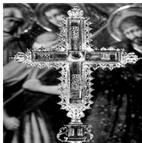
Santísima Vera Cruz de Caspe