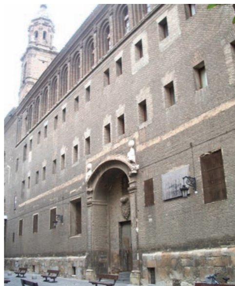
Fachada del Real Seminario de San Carlos.