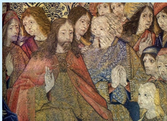
Cristo en el tapiz “La Resurrección de Lázaro”. Telar de Bruselas. Hacia 1500. Colección capitular. La Seo. Zaragoza

Cuando, en el quinto domingo, se proclama LA RESURRECCIÓN DE LÁZARO , nos encontramos frente al misterio último de nuestra existencia: “Yo soy la resurrección y la vida... ¿Crees esto?” (Jn 11, 25-26). Para la comunidad cristiana es el momento de volver a poner con sinceridad, junto con Marta, toda la esperanza en Cristo, el Hijo de Dios, el que iba a venir al mundo (v. 27). La comunión con Cristo en esta vida nos prepara a cruzar la frontera de la muerte, para vivir sin fin en Él. La fe en la resurrección de los muertos y en la esperanza en la vida eterna abren nuestra mirada al sentido último de nuestra existencia: Dios ha creado al hombre para la resurrección y para la vida, y esta verdad da la dimensión auténtica y definitiva a la historia de los hombres, a su existencia personal y a su vida social, a la cultura, a la política, a la economía. Privado de la fe todo el universo acaba encerrado dentro de un sepulcro sin futuro, sin esperanza. (Benedicto XVI. Mensaje para la Cuaresma 2011).