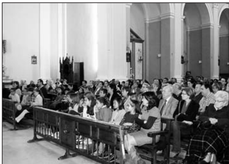
Uno de los actos en la Parroquia de Villanueva.

El pasado 3 de abril, se clausuró la exposición conmemorativa "50 Años de Acción Social de Cáritas", que va recorriendo zonas y localidades de la Diócesis de Zaragoza. Las personas interesadas de la zona de Zuera han tenido oportunidad de visitarla en el centro parroquial Felipe Cativiela de Villanueva de Gállego. La exposición ha estado abierta durante un mes.