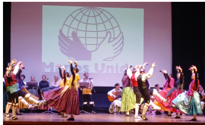
Grupo de Jota Uruel.

Queremos expresar nuestro más sincero agradecimiento al Grupo de Jota Uruel por su compromiso y predisposición, demostrando desde el primer momento su interés en colaborar con esta causa solidaria. También queremos agradecer al público asistente, cuya gene-