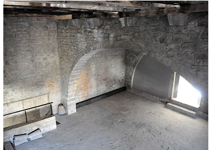
Catedral de Jaca. Interior de la torre campanario.

El relato contará con técnicas de gamificación y con la Condesa Doña Sancha Ramírez como introductora de ese viaje hasta la Jaca de hace 1.000 años.