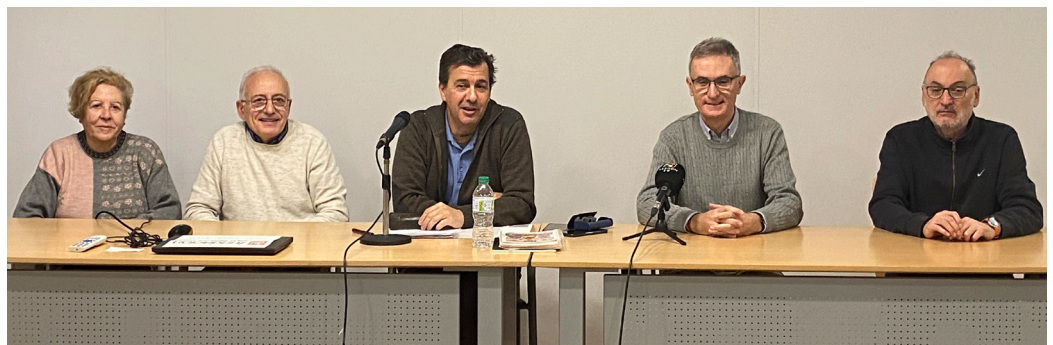
Miembros de EPJ en la rueda de prensa celebrada el pasado miércoles 4 de diciembre.

Desde la plataforma aseguran que «la cooperación no es sólo un acto de solidaridad, sino un