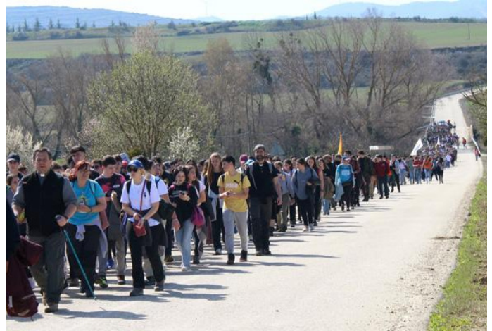
Momento de la peregrinación al castillo de Javier.