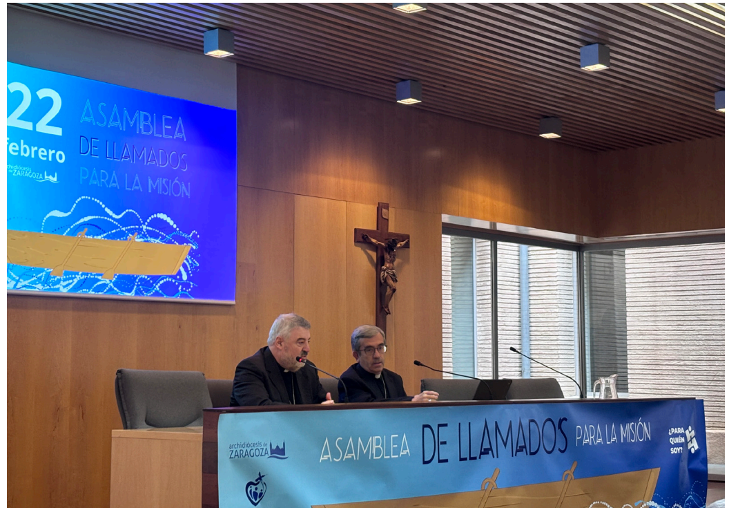
El arzobispo don Carlos presenta al presidente de la Conferencia Episcopal en la jornada del sábado.

Ante esta cuestión, Argüello reconoció que «en una tierra como la nuestra, después de siglos de empaste entre sociedad e Iglesia, somos llamados a situarnos de forma nueva en la