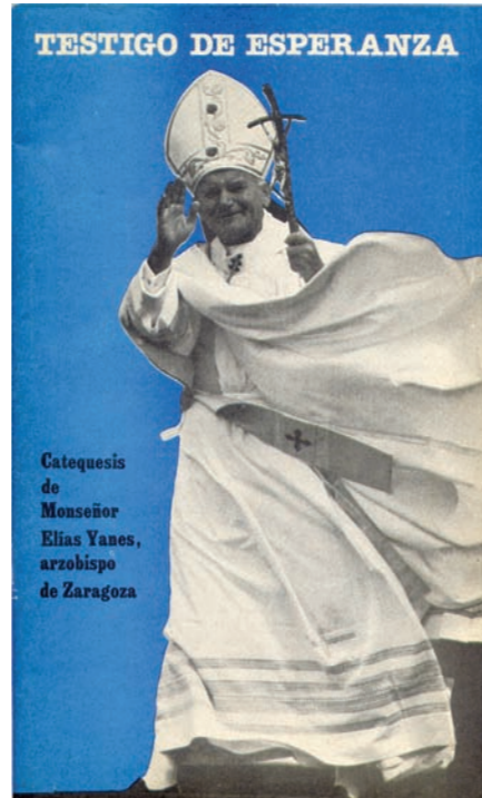
Diversas publicaciones para preparar las dos visitas del Papa.