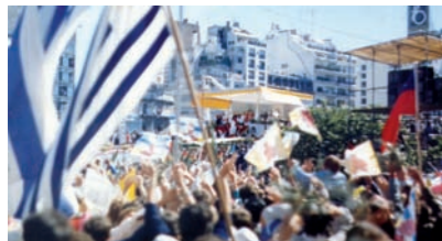
Con los enfermos en La Romareda.