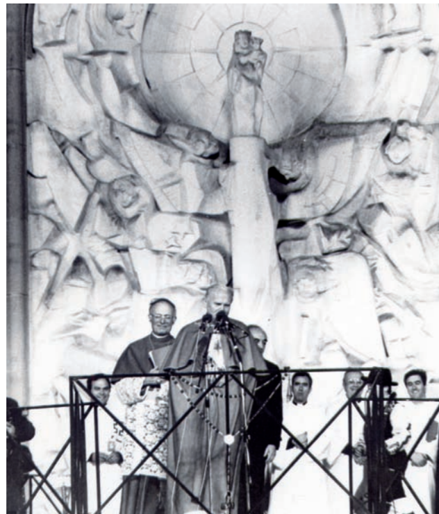
Juan Pablo II rezando el Rosario en la Plaza.