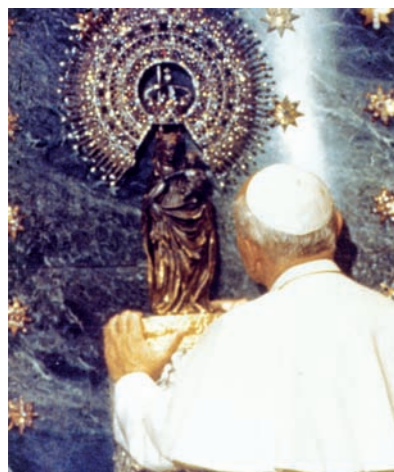
Ayudado en El Pilar.

su Sagrada Imagen. Con nosotros rezó el Santo Rosario en la plaza y se emocionó escuchando nuestra jota y el sonido de los tambores - "Si el que canta reza dos veces, se preguntó con fino humor, ¿cuántas veces reza el que baila para gloria de María? Un problema para los teólogos"- . De aquellas visitas han pasado ya casi 30 años, pero siguen vivas en el recuerdo de muchas personas. Hoy las evocamos con fotografías de unos días inolvidables.