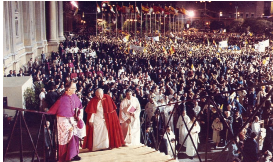
Juan Pablo II llega a la Plaza del Pilar en la primera visita, 1982.