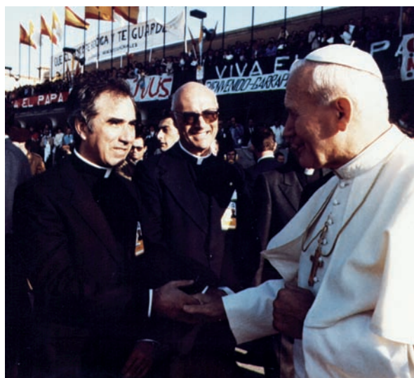
Despedida en el aeropuerto.